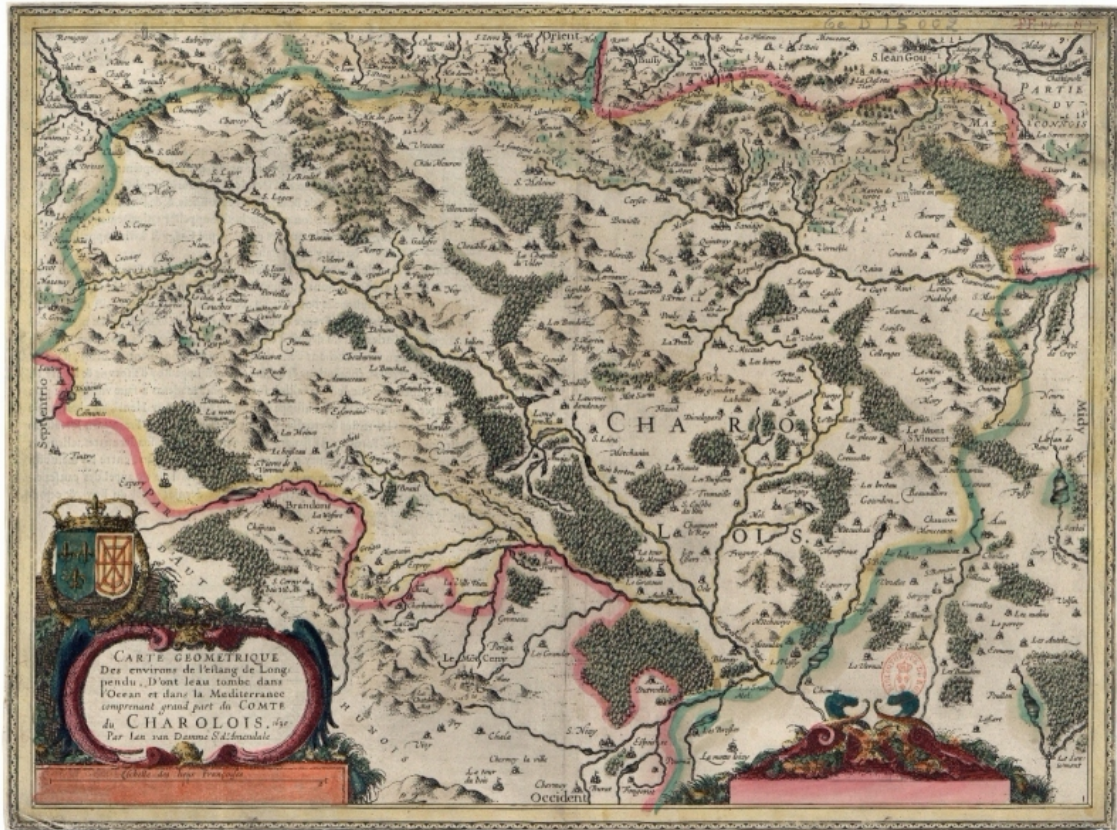
Figure 4. Carte géométrique des environs de l'estang de Longpendu, comprenant une grande partie du Comté du Charolois par Ian van Damme Sr d'Amen-dale

GE D-15002, BnF ( https://gallica.bnf.fr/ark:/12148/btv1b8493038x?rk=128756;0 ).