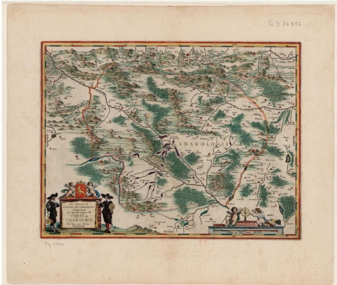
Figure 1. La carte des « Environs de l'étang de Longpendu, comprenant une grande partie du Comté du Charolois par Ian van Damme Sr d'Amendale »