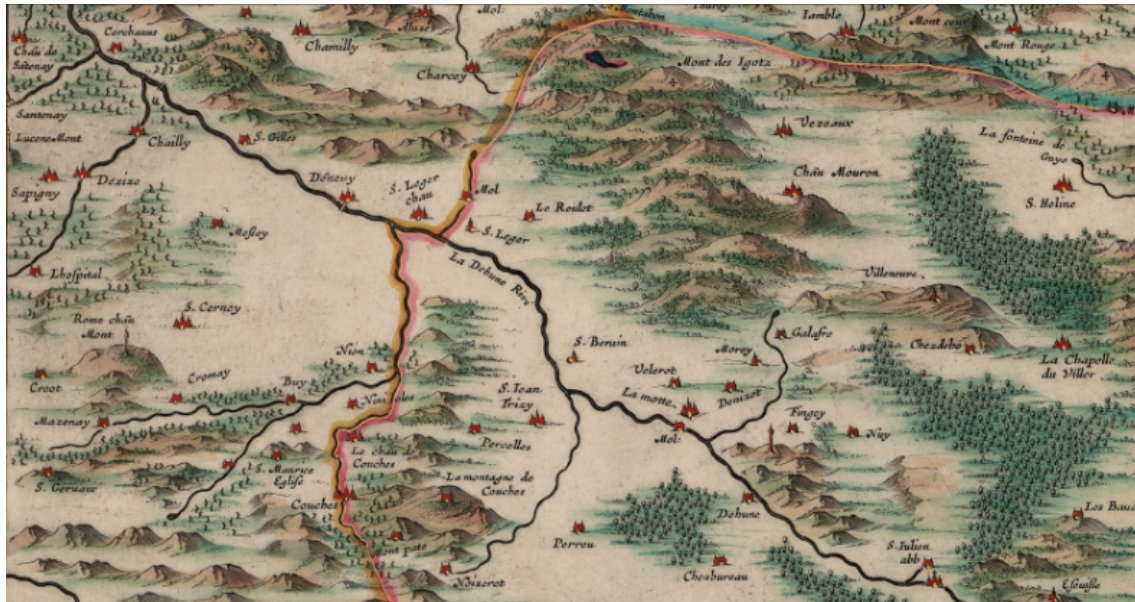
Figure 5 : Agrandissement de la figure 1 centrée sur la rivière Dheune et les bordures est et nord-est montrant les vignes et les forêts