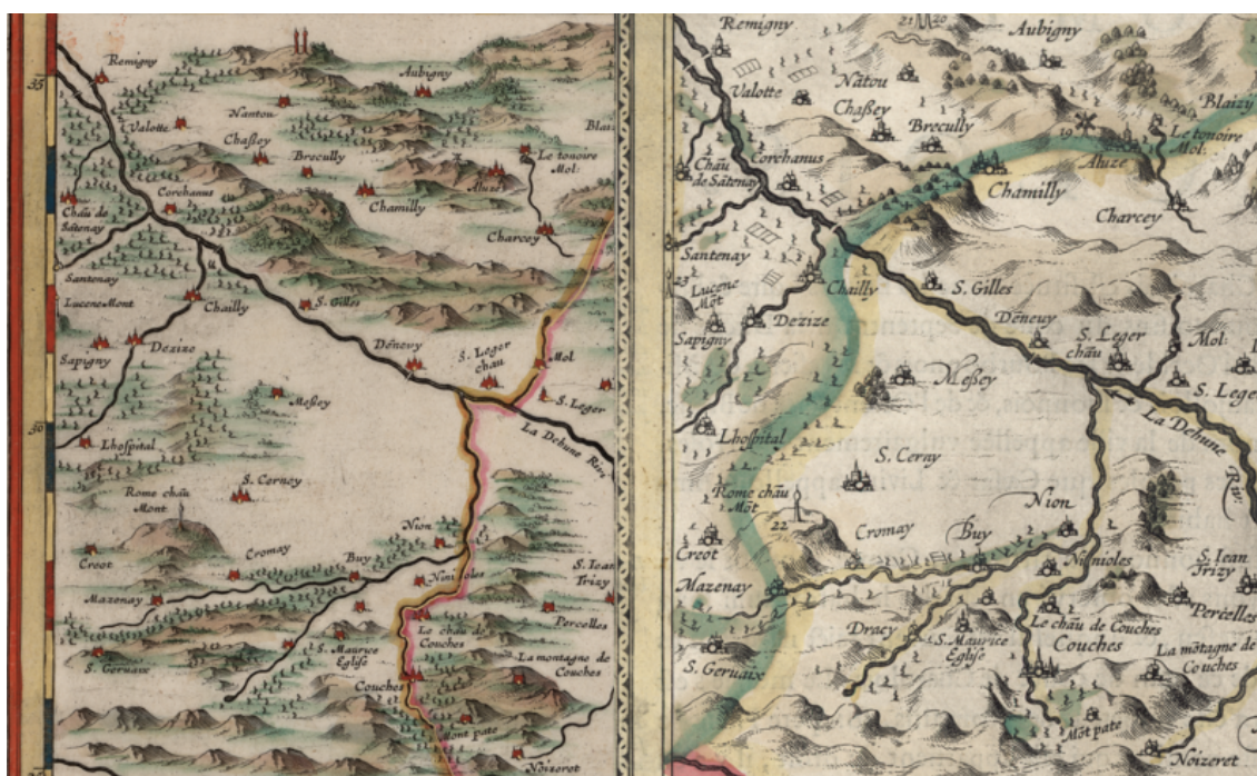
Figure 6 : comparaison des vignobles situés au Nord-Est des deux versions de la carte « des environs de l'estang de Longpendu »