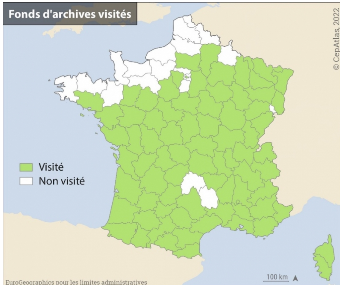
Figure 1 : Dépôts d'Archives Départementales visités dans le cadre du programme CepAtlas.

Les déplacements ont eu lieu en 2020-2021, fortement perturbés par les restrictions sanitaires. La carte utilise les départements actuels mais l'ensemble des dépôts d'archives des départements d'Ile-de-France ont été visités (Paris, Seine-et-Marne et Yvelines), tout comme les archives qui correspondent à l'actuel Territoire de Belfort (qui faisait partie du Haut-Rhin au début du XIX e siècle). Seuls les dépôts d'Archives Départementales des Ardennes, de l'Eure et de la Lozère n'ont pu être visités car les conditions de déplacement et/ou d'accès aux salles de lecture étaient trop restreintes et que les inventaires (ainsi que des échanges avec les archivistes) indiquaient qu'aucun document n'avait été conservé.