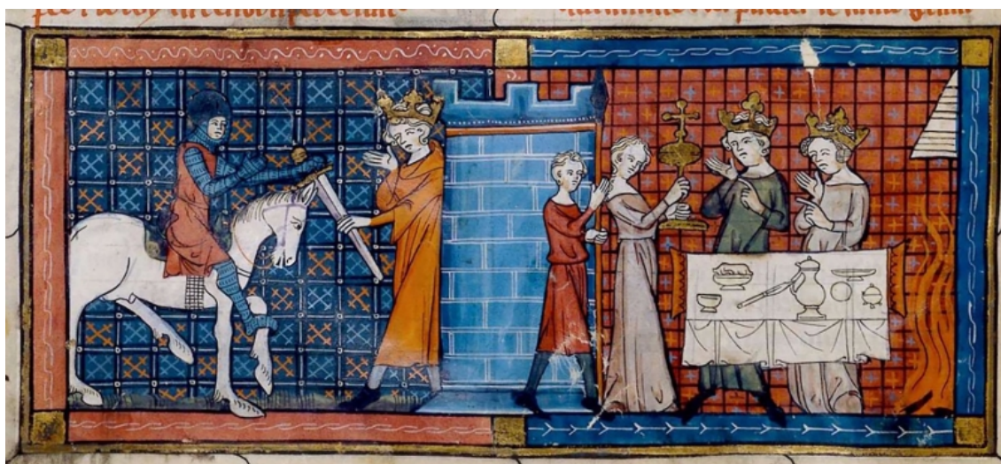
Fig. 1. Représentation du service du raspez dans le roman de Perceval. Dans son roman courtois Li Contes del Graal ou Le roman de Perceval , écrit vers 1180, Chrétien de Troyes fait servir du raspez par le maître de maison lors du festin dans le château du Graal.

Manuscrit enluminé du copiste Guiot en dialecte champenois, début du XIV e siècle.