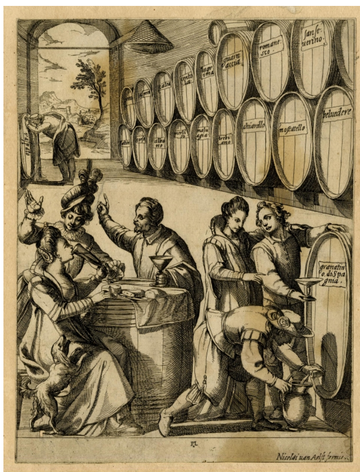
Fig. 6. Les ambiguïtés du raspato .

Dans une boutique de vin à Rome, une dame boit dans une flûte élancée, peut-être du raspato ? Le monsieur en face d'elle montre du doigt un homme en arrière-plan qui vomit devant un tonneau de raspato . Il se peut qu'il mette ainsi en garde contre une consommation excessive, car le raspato avait la réputation de monter rapidement à la tête. Vini di Roma , gravure sur cuivre de Nicolaus van Aelst (1526-1613), fin du xvi e siècle environ. Originaire de Bruxelles, van Aelst a travaillé à Rome de 1550 à sa mort.