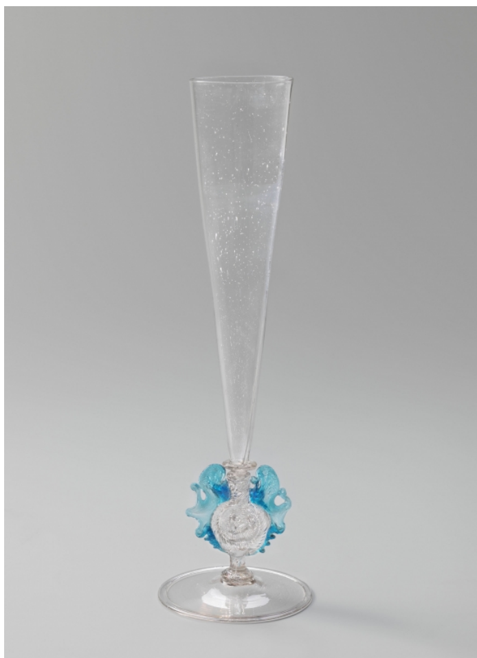
Fig. 5. Verre vénitien.

Depuis le xvi e siècle, les verriers vénitiens produisent des verres fins et transparents en cristal (le crystallo ), qui mettent en valeur les bulles des vins mousseux. Cette forme de verre s'est ensuite imposée comme flûte à champagne. Verre à flûte avec ailes bleues, Venise, env. 1550-1600.