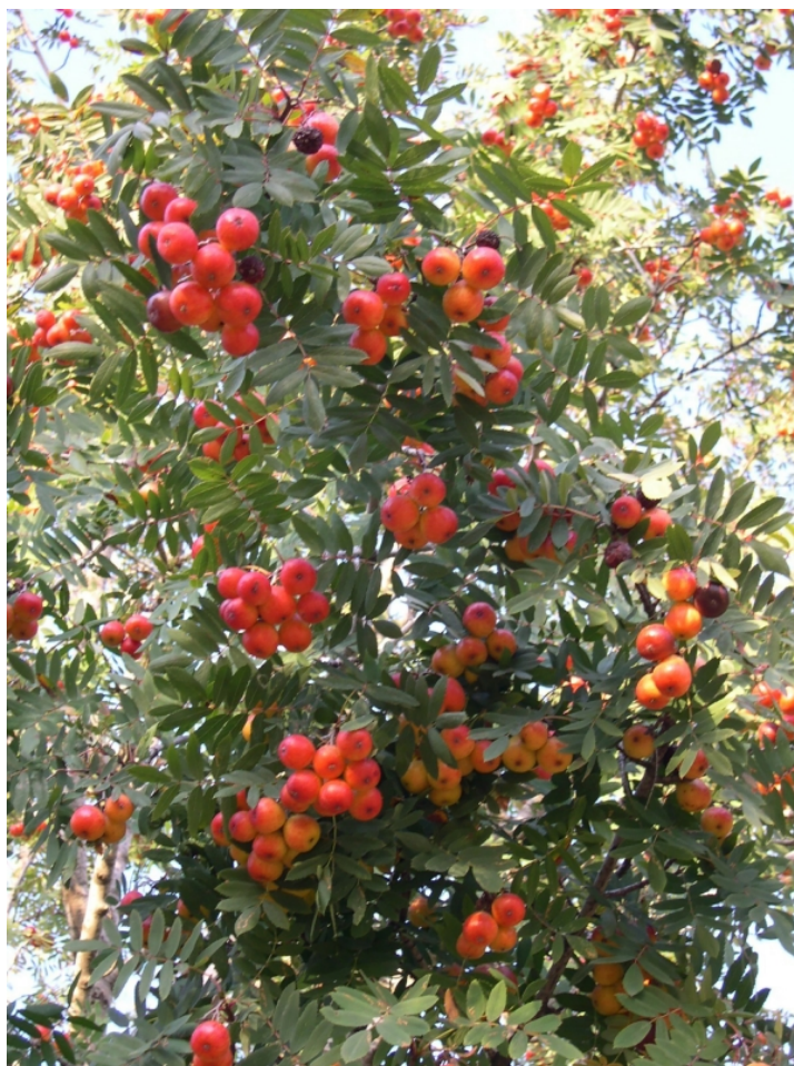
Fig. 4. Un des ingrédients du raspato en Italie : le cormier. Les fruits tanniques du cormier ( Sorbus domestica ) étaient ajoutés au raspato en Italie pour le clarifier et le coller.