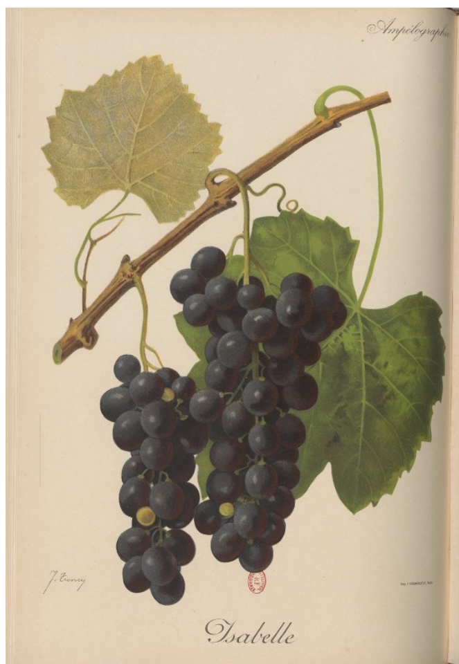
Figure 2 : Isabelle.

Peinture de KREÏDER A. et TRONCY J., in : VIALA P. et VERMOREL V. (dir.), 1904, Traité général de viticulture. Ampélographie . [En ligne : https://gallica.bnf.fr/ark:/12148/bpt6k65365603/f308.item.textelimage ], tome V.