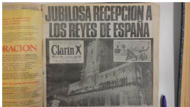
Foto 4. Tapa de Clarín , lunes 27 de noviembre de 1978: « Jubilosa recepción de los reyes de España ».