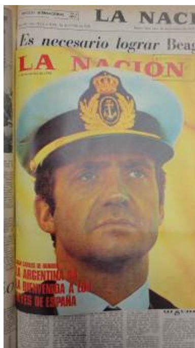
La Nación , domingo 19 de noviembre de 1978. Título: « Juan Carlos de Borbón. La Argentina da la bienvenida a los reyes de España ».