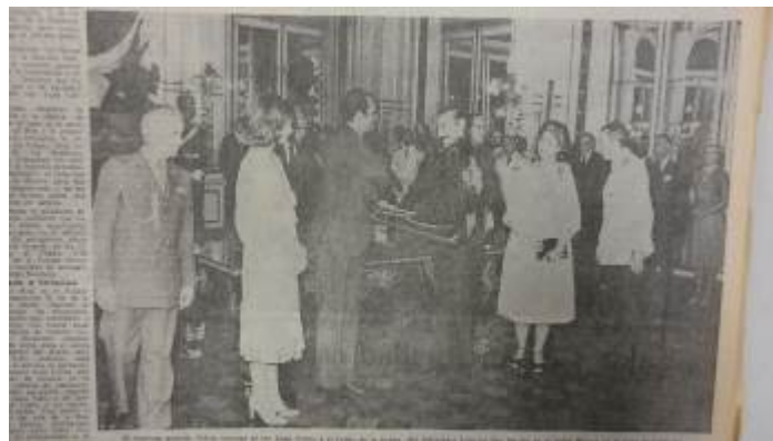
Foto 3. La Nación , lunes 27 de noviembre de 1978. Título: « El intercambio de decoraciones », p. 12.

lectorado: el intercambio de condecoraciones en la Casa de Gobierno FOTO 3, sobre todo el cruce de la Plaza de Mayo, entre una « entusiasta multitud », de la pareja real y de la pareja « presidencial », la visita del Cabildo con la escena conocida del saludo desde el balcón FOTOS 4 y 5- frente al de la Casa Rosada, símbolo de otro tiempo y signo políticos, y al que nunca saldría ningún militar, hasta que Galtieri anunciara la recuperación de las Malvinas el 10 de abril de 1982.