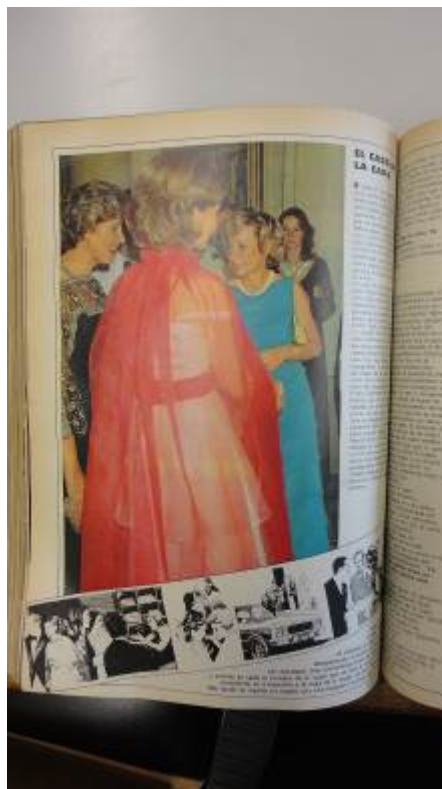
Revista Gente, 7 de diciembre de 1978: « El caso de la capa » (sin paginación).