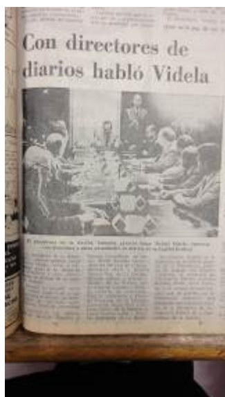
Tapa de La Nación , sábado 25 de noviembre de 1978. Título: « Con directores de diarios habló Videla ».