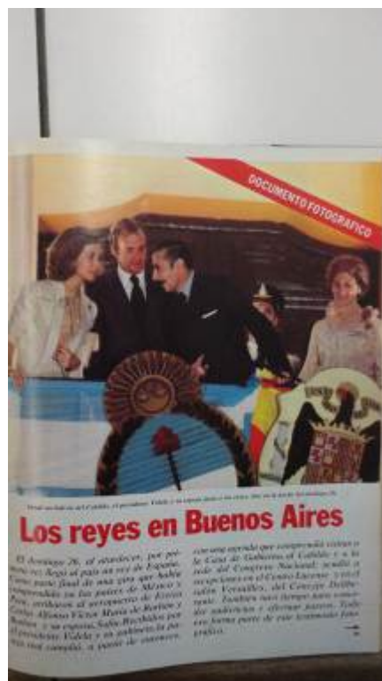
Foto 5. Revista Somos, 1º de diciembre de 1978: « Los reyes en Buenos Aires », p. 31.