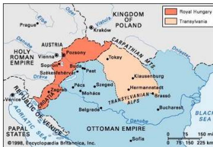
Cuadro 2.- Hungría dividida en tres partes