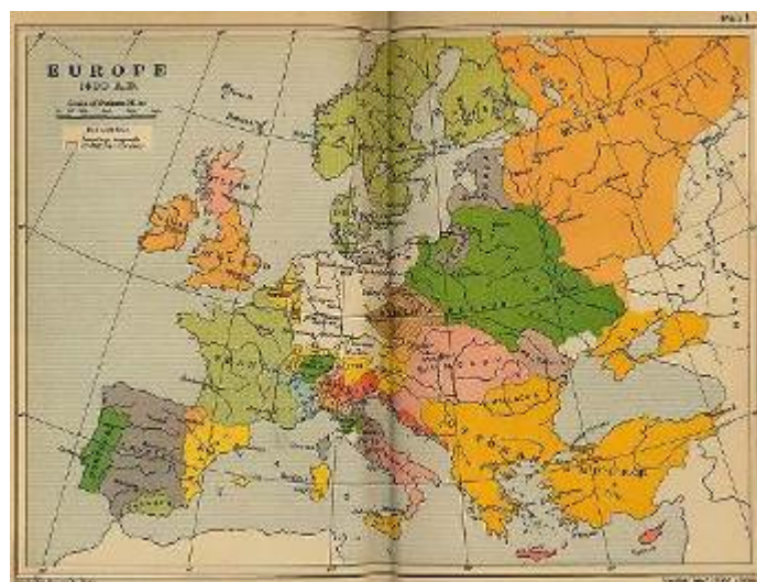
Cuadro 1.- Europa y el Reino de Hungría en 1490