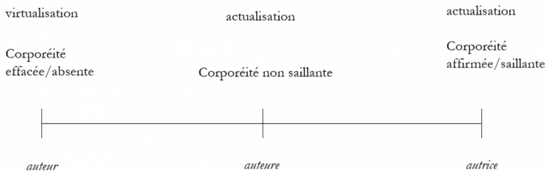
Figure 3 : Degrés d'actualisation et de corporéité des termes auteur, auteure et autrice