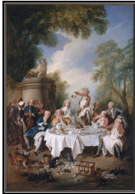
1 Lancret Nicolas, Déjeuner au jambon , 1735, huile sur toile, 188 x 123 cm, Chantilly, Musée Condé.