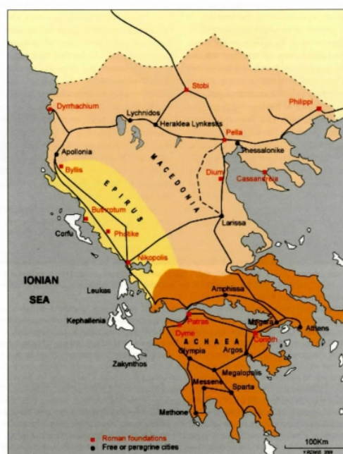
Carte des centres urbains majeurs de Macédoine et d'Achaïe (Rizakis, 2010, p. 7).