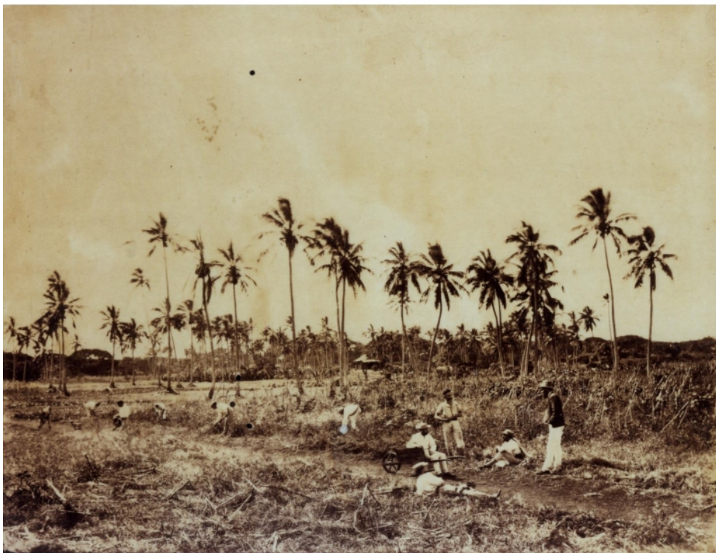
ANC collection Serge Kakou reproductions de clichés anciens, 148 Fi 36 - 82 Allan Hughan. « Concessions de déportés à l'île des Pins, 1876. »