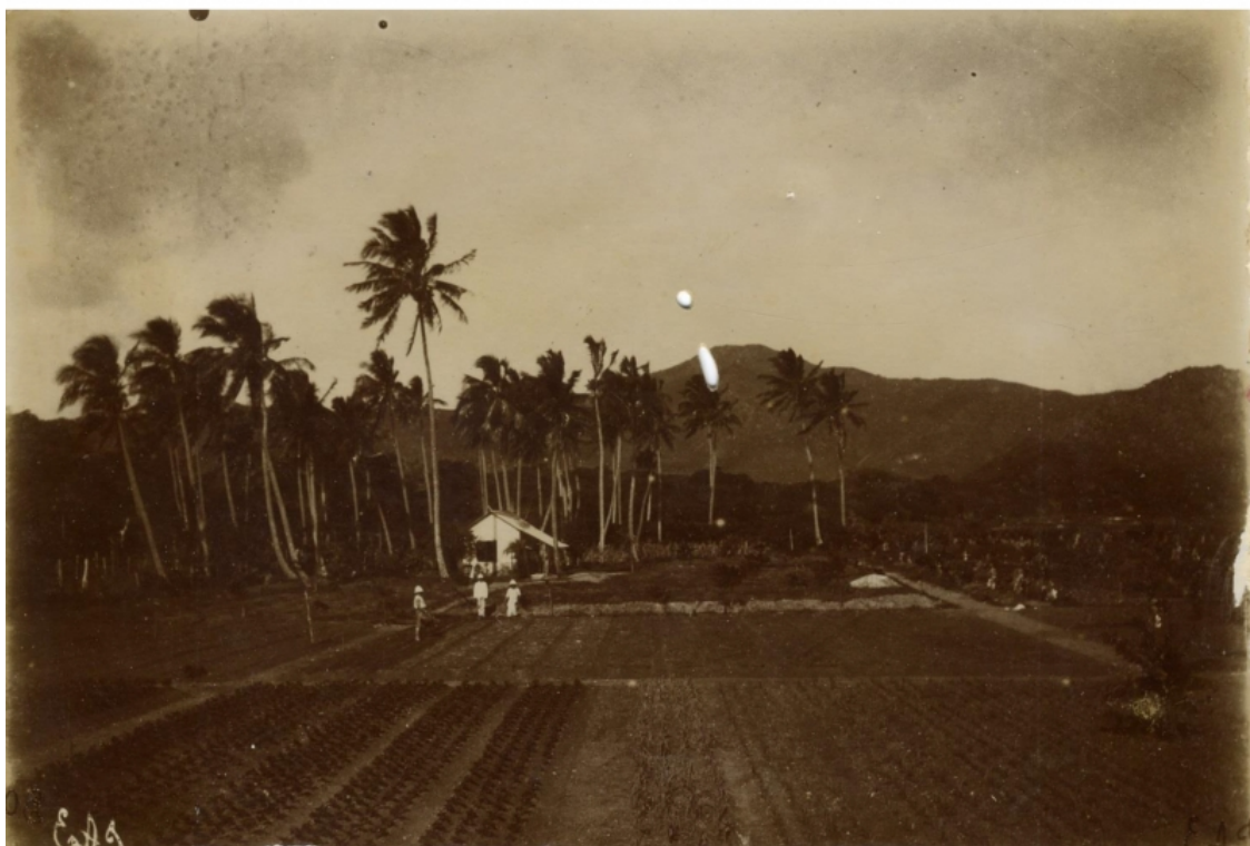
11 x 18 cm « Vue du jardin de la troupe, Ile des Pins. »