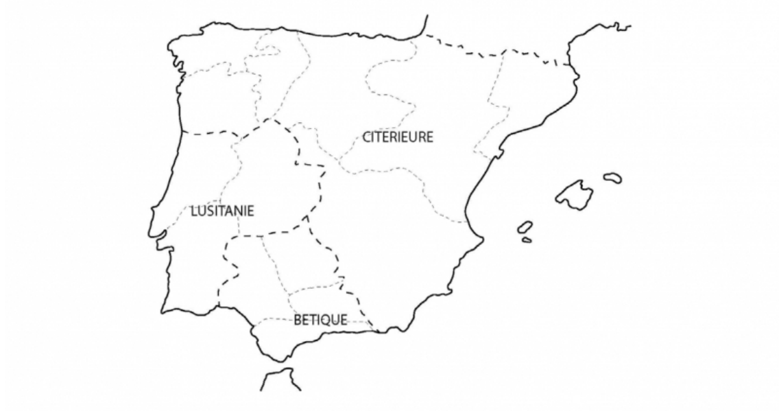
Fig. 1 : La péninsule Ibérique à l'époque impériale