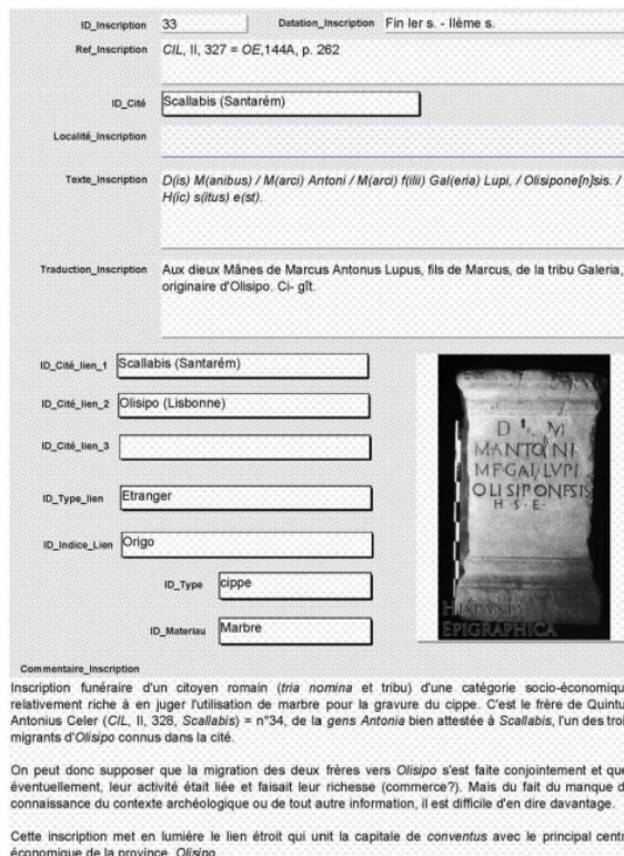
Fig. 5 : Exemple d'une fiche de la base de données épigraphiques