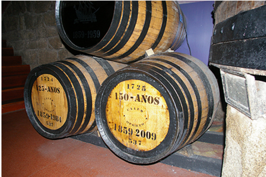
Cave Calem à Porto, Cliché : O. Jacquet