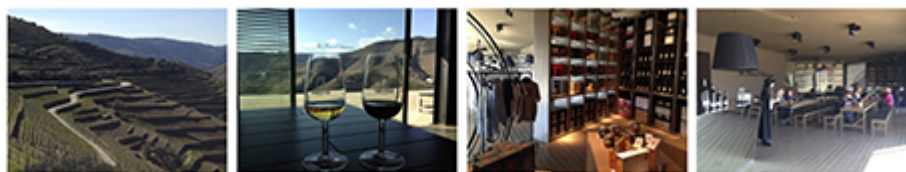
Clichés de Philippe Baumert, mars 2015.

Illustration 4 : L'œnotourisme au sein de la Quinta do Seixo (propriété de Sandeman située à Valença do Douro). De gauche à droite : vues du vignoble de la Quinta do Seixo depuis la salle de dégustation, boutique de la maison Sandeman, vue de la salle de dégustation lors de la dégustation commentée.