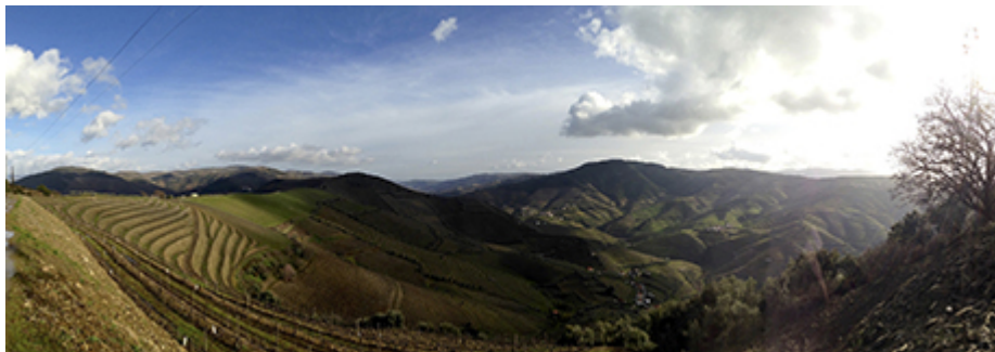
février 2014