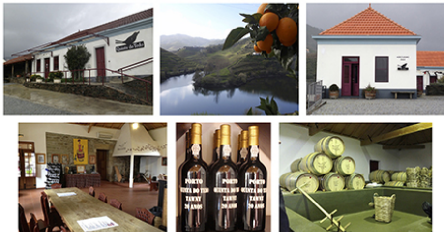
Clichés de Philippe Baumert, février 2014.

Illustration 3 : L'œnotourisme au sein de la Quinta do Tedo (propriété de Vincent Bouchard située à Folgosa). De gauche à droite, de haut en bas : clichés de la Quinta do Tedo, du Rio Tedo et des vignobles, du nouveau bâtiment destiné à héberger les touristes, de la salle de dégustation avec ses bouteilles de Porto et du lagar.