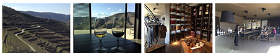
Clichés de Philippe Baumert, mars 2015.

Illustration 4 : L'œnotourisme au sein de la Quinta do Seixo (propriété de Sandeman située à Valença do Douro). De gauche à droite : vues du vignoble de la Quinta do Seixo depuis la salle de dégustation, boutique de la maison Sandeman, vue de la salle de dégustation lors de la dégustation commentée.