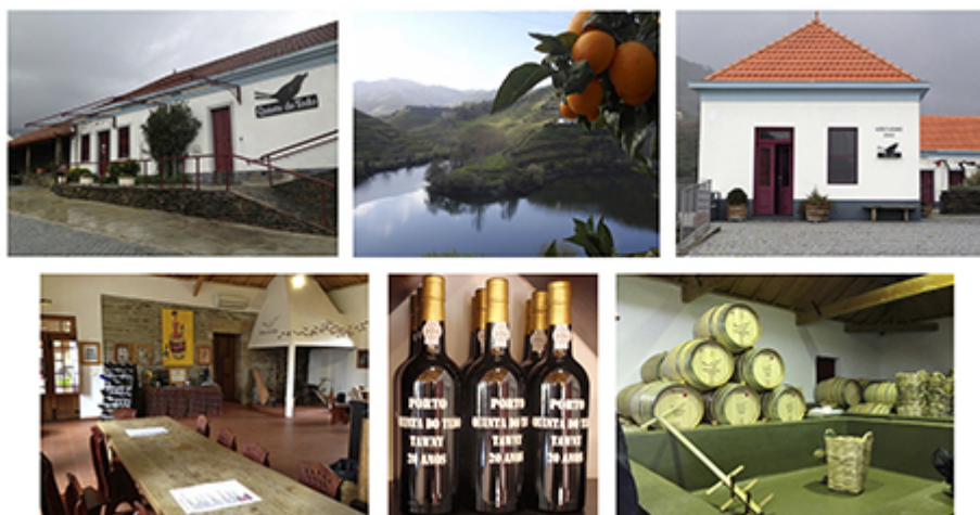
Clichés de Philippe Baumert, février 2014.

Illustration 3 : L'œnotourisme au sein de la Quinta do Tedo (propriété de Vincent Bouchard située à Folgosa). De gauche à droite, de haut en bas : clichés de la Quinta do Tedo, du Rio Tedo et des vignobles, du nouveau bâtiment destiné à héberger les touristes, de la salle de dégustation avec ses bouteilles de Porto et du lagar.