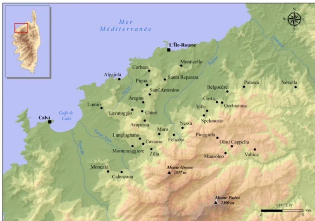
Figure 2 : l'AOC Corse Calvi ( www.vinsdecorse.com )