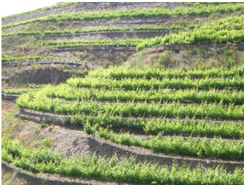
Priorat, 11.6.2004.