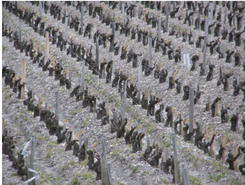
Images 1 et 2. Vignobles du Château Pichon Longueville Comtesse de Lalande, dans la région vitivinicole de Bordeaux (France).