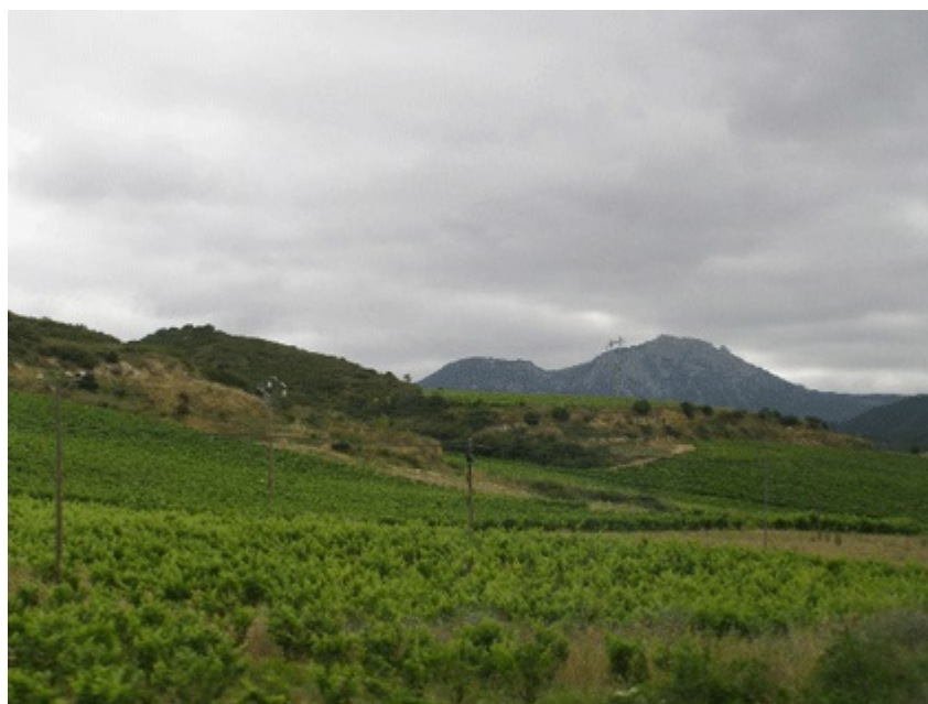
Haro (Espagne), 19.7.2007.