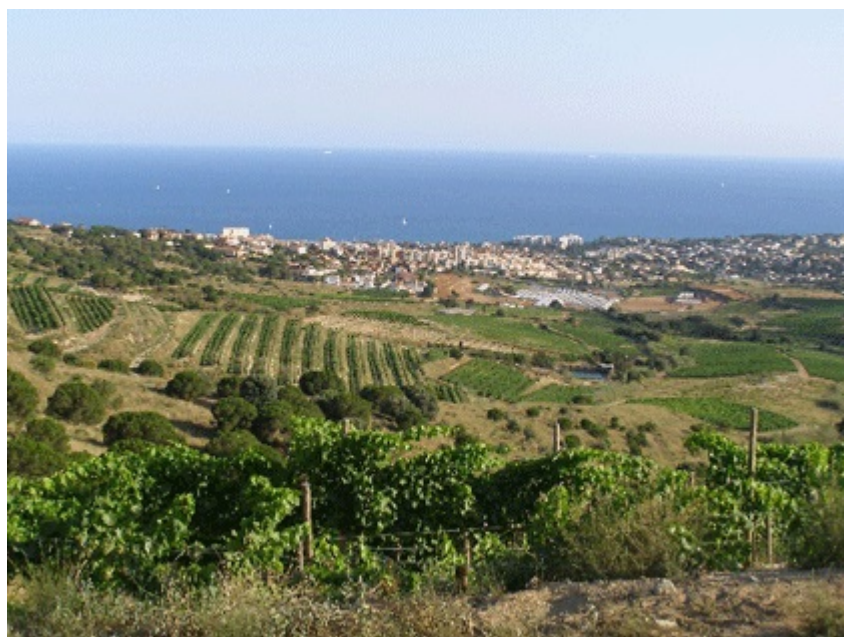
Vall de Rials dans la commune d'Alella, 7.7.2008.