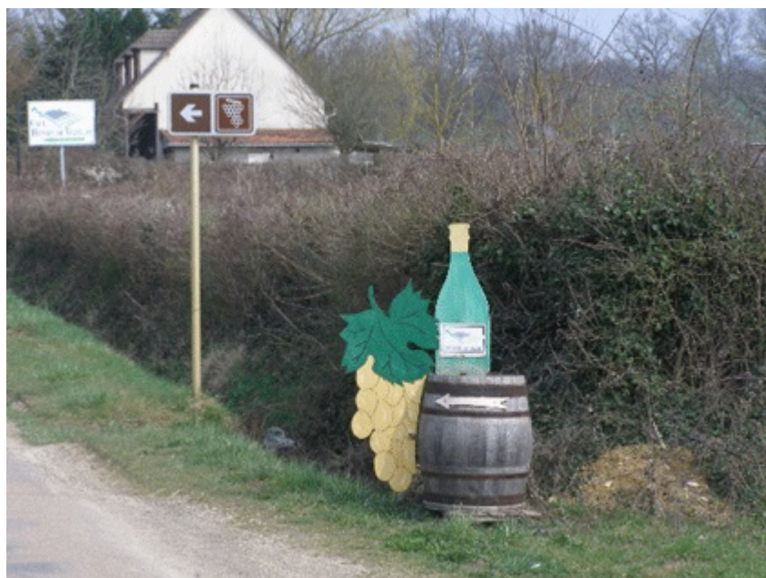
cave coopérative Henry de Vézelay (Bourgogne, France), 3.4.2009.