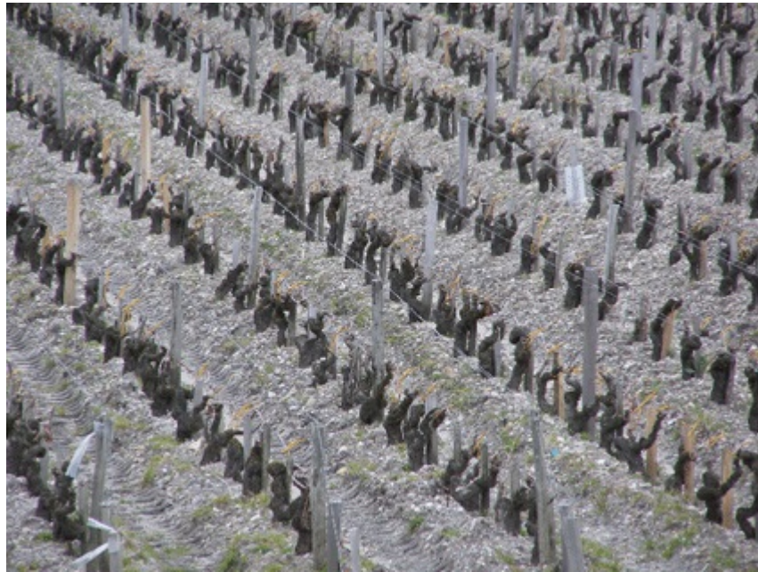
Images 1 et 2. Vignobles du Château Pichon Longueville Comtesse de Lalande, dans la région vitivinicole de Bordeaux (France).