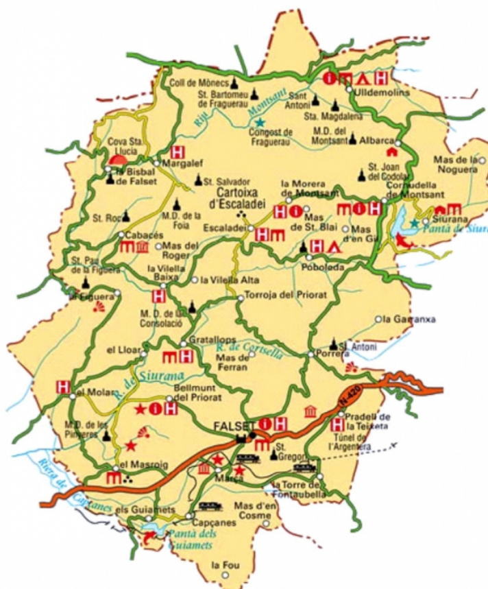
Figure 3. Carte de la région du Priorat

superficie, c'est-à-dire 23,60%. La culture de la vigne alterne avec celle des oliviers et des amandiers.