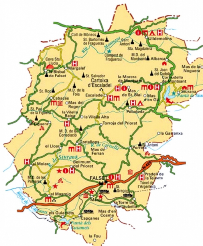
Figure 3. Carte de la région du Priorat

superficie, c'est-à-dire 23,60%. La culture de la vigne alterne avec celle des oliviers et des amandiers.