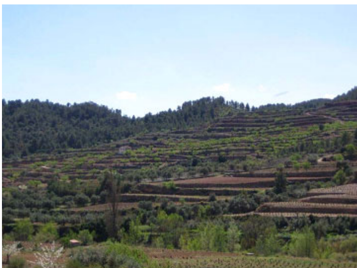
Figure 5. Paysage caractéristique du Priorat