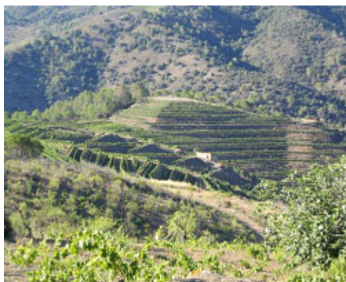
Figure 8. Création de terrasses pour la culture de la vigne en espalier