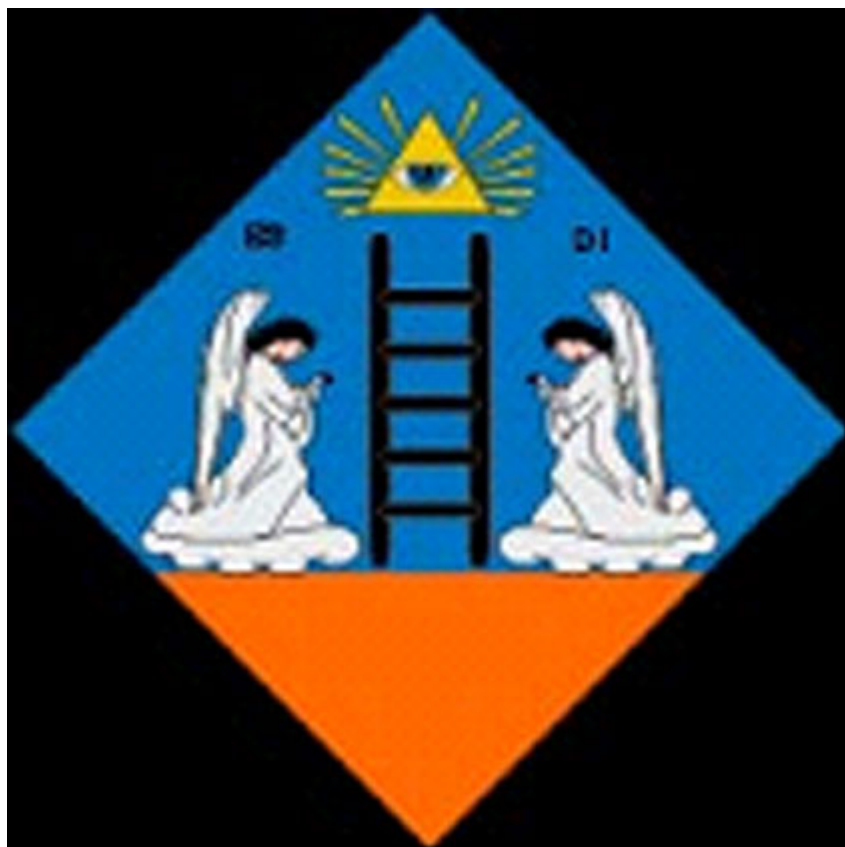
Figure 1. Blason de Scala Dei