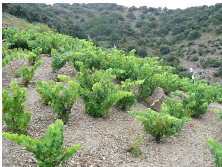
Figure 6. Culture de vieux ceps en pente. Sol d'ardoise