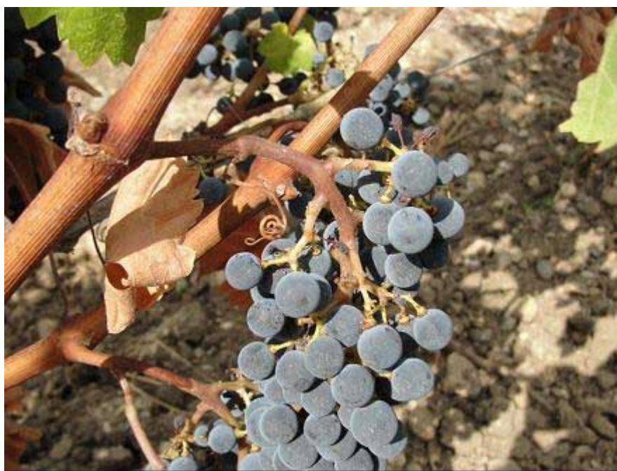
Figura 5. Cachos de Cabernet Sauvignon (esquerda) em vinhedo de clima temperado com lignificação do engaço; e Syrah (direita), próximo da colheita, em vinhedo cultivado em região de clima tropical semiárido, em Lagoa Grande (PE, Brasil), com engaço não lignificado.

67 A Figura 5 mostra uma comparação de dois cachos de uva, no momento da colheita. À esquerda, pode-se observar um cacho da uva Cabernet Sauvignon próximo à data da colheita, em região de clima temperado. À direita, um cacho de Syrah próximo à colheita, em julho de 2017, em uma região de clima tropical semiárido, em Lagoa Grande (PE), no Vale do São Francisco. Pode-se observar que o cacho de Cabernet Sauvignon apresenta engaço lignificado, de coloração marrom, o que garante maior resistência, e que dificilmente irá se quebrar ao ser desengaçado com equipamento. Já o cacho do VSF apresenta engaço verde, flexível e quebradiço, sendo facilmente quebrado com uso de desengaçadeira/esmagadora. Por isso a adoção de uma das três alternativas citadas acima, pode contribuir para uma melhora qualitativa de vinhos tintos tropicais do VSF.