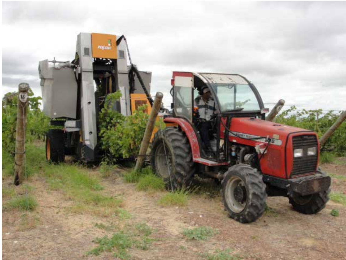
Figura 4. Colheita mecânica de uva Chenin Blanc em empresa vinícola localizada no município de Casa Nova – BA.