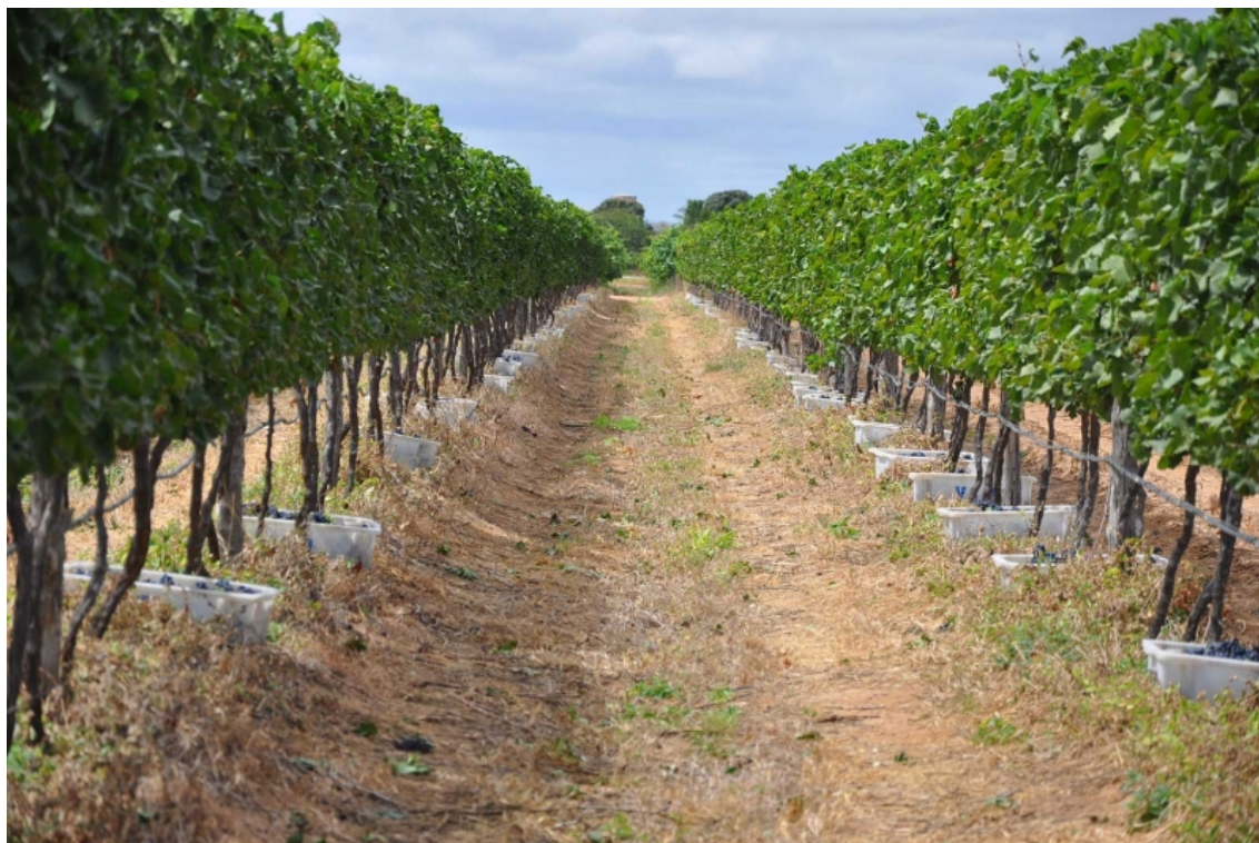
Figura 3. Cultivar Tempranillo conduzida em espaldeira, em período de colheita da uva, em empresa vinícola localizada no município de Lagoa Grande – PE.