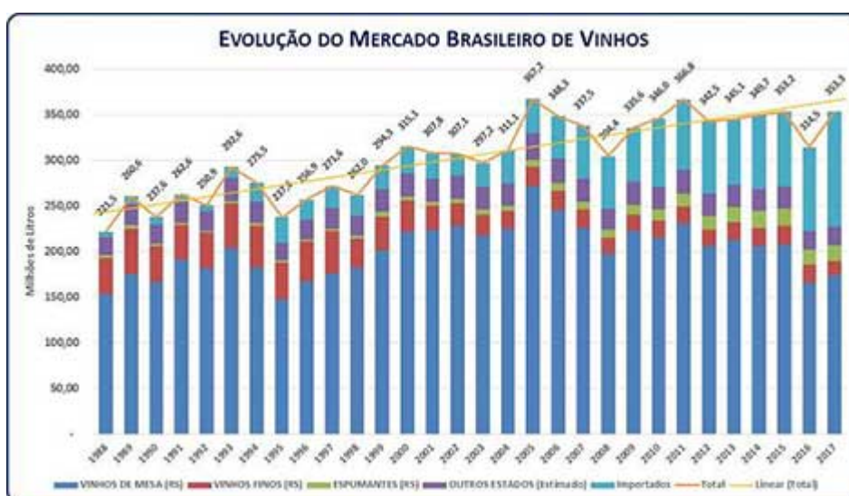
Figura 1. Destino das uvas americanas e híbridas processadas no Rio Grande do Sul, em porcentagem.