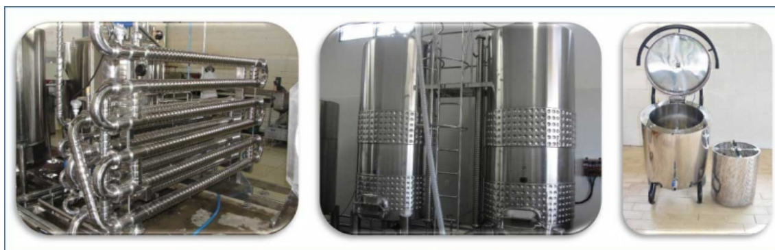
Figura 4. Equipamentos usados para elaboração de sucos de uva, por meio de aquecimento.

Foto 1 - Tubulação de extração e elaboração de sucos, com uvas circulando na tubulação e posterior separação por esgotadores; Foto 2 - Cuba vertical de extração e elaboração de sucos, com uvas estáticas e bombeamento externo do suco durante a extração; e, Foto 3 - Suquificador, novo equipamento para elaboração de suco de uva integral em pequenos volumes.