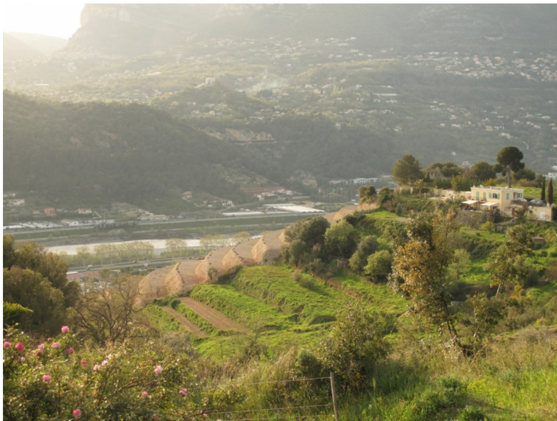
Illustration 6 : Nouvelles terrasses. avril 2018