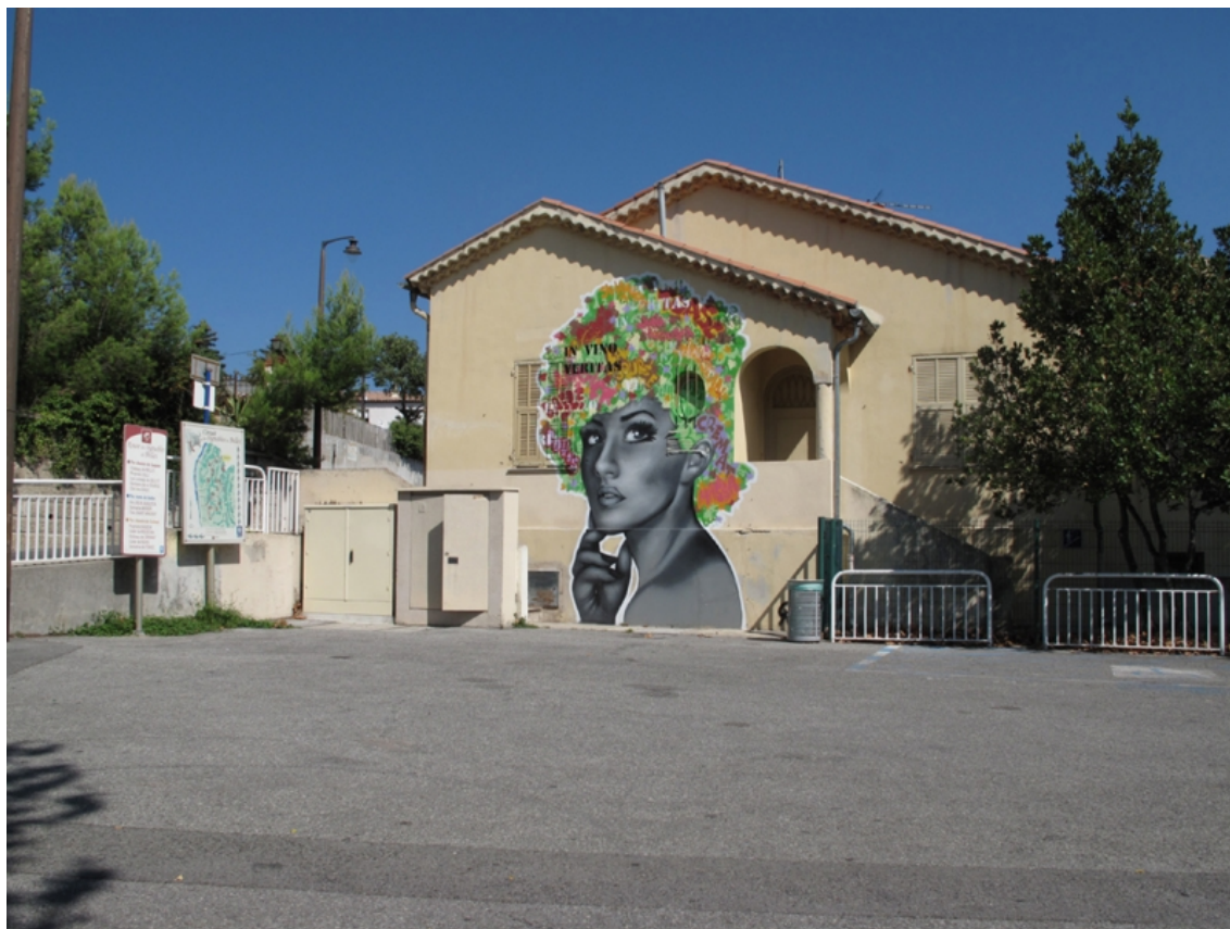
Illustration 5 « Place des vigneronns de Bellet » à Saint Roman de Bellet, décorée d'une fresque. Cliché de l'auteur, septembre 2018