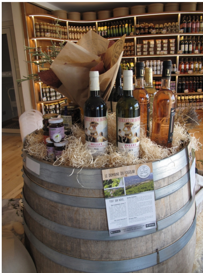
Illustration 8 : Intérieur de la boutique et présentation des vins de Bellet.