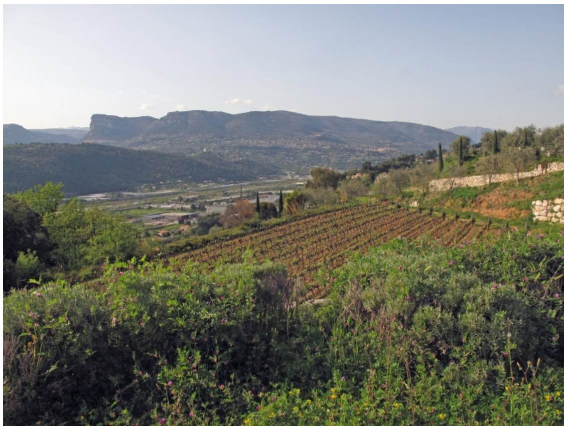
Illustration 1 : Vignes en surplomb de la vallée du Var. Cliché de l'auteur, 2018