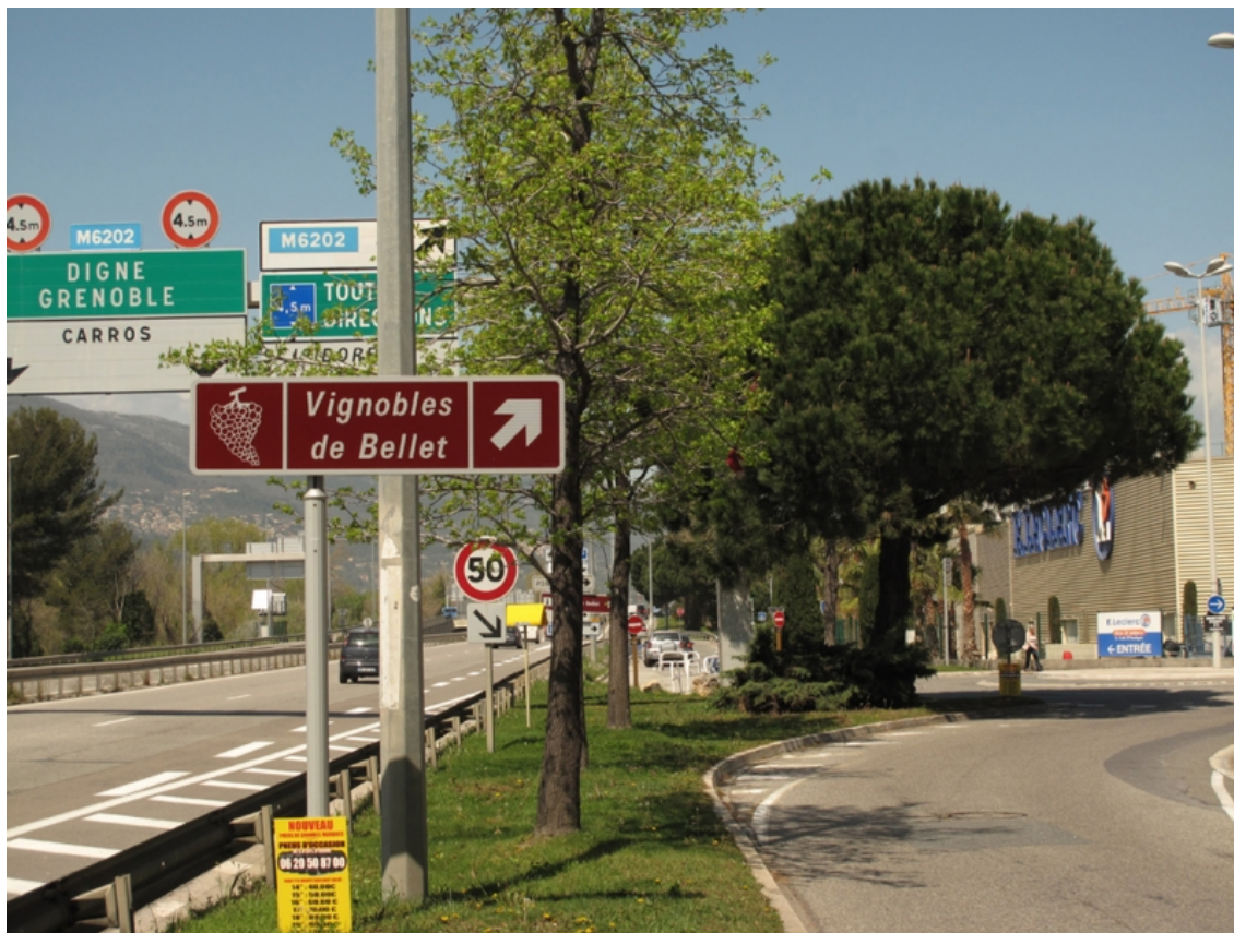
Illustration 3 : Signalisation routière des « Vignobles de Bellet » dans la zone commerciale de Saint-Isidore. Cliché de l'auteur 2018