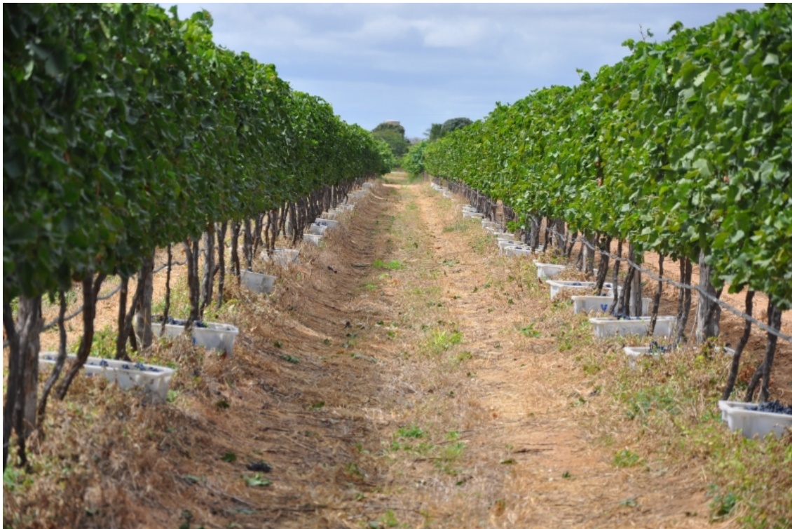
Figure 3. Cépage Tempranillo conduit en espalier, pendant les vendanges, dans une entreprise vinicole de la municipalité de Lagoa Grande – PE.