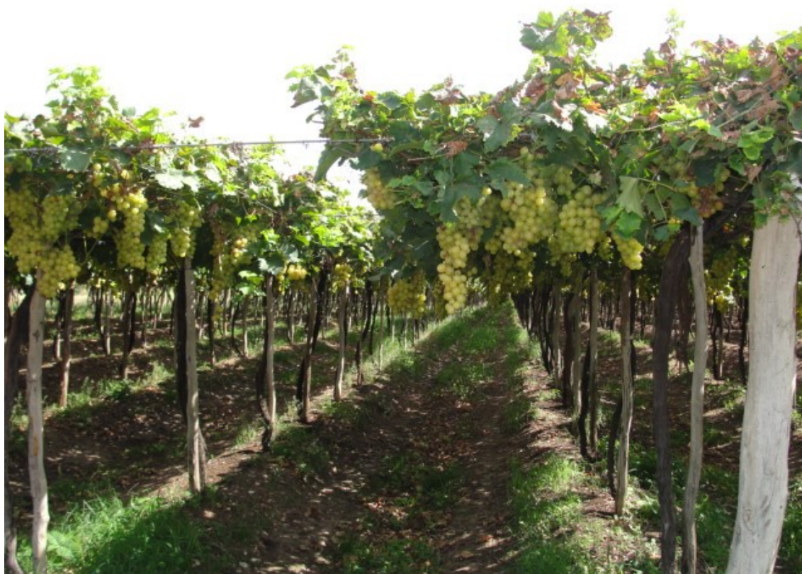
Figure 1. Cépage Moscato Itália planté en pergola, dans une entreprise vinicole située dans la municipalité de Casa Nova – BA.