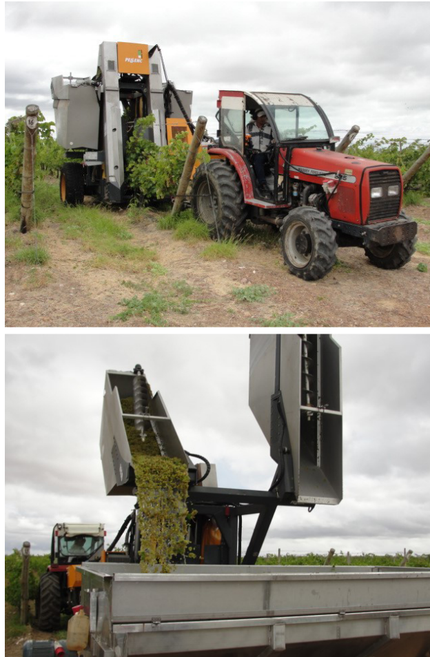
Figure 4. Vendange mécanique du Chenin Blanc dans une entreprise viticole de la municipalité de Casa Nova – BA.