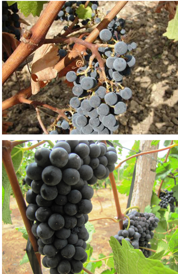
Figure 5. Grappes de Cabernet Sauvignon (à gauche) dans un vignoble tempéré avec lignification de la rafle ; et Syrah (à droite), peu avant la récolte, dans un vignoble tropical semi-aride, à Lagoa Grande (PE, Brésil), avec rafle non lignifiée.