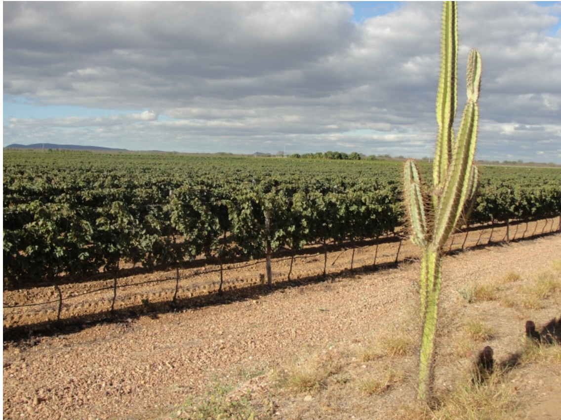
Figure 2. Cépage Tempranillo conduit en espalier dans une entreprise vinicole de la municipalité de Lagoa Grande – PE.