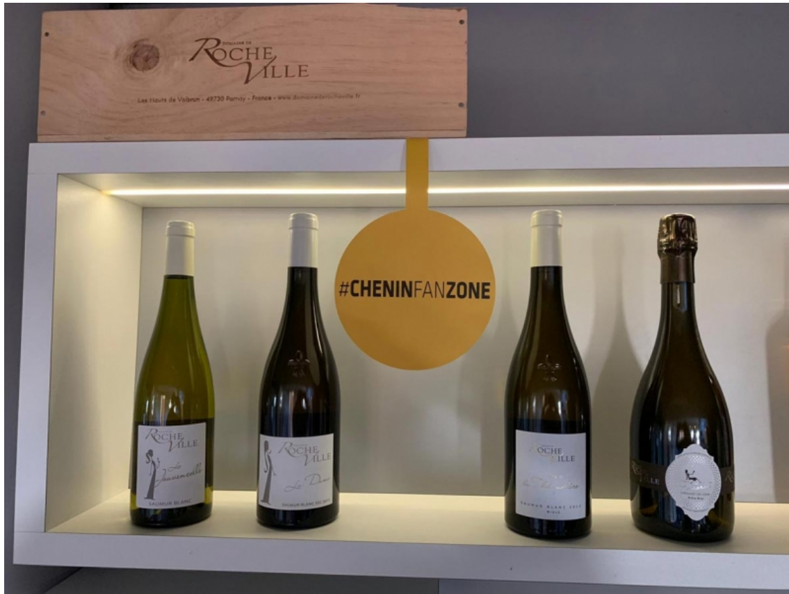
Figure 3 : Identification d'un producteur de Chenin dans une Fan zone.