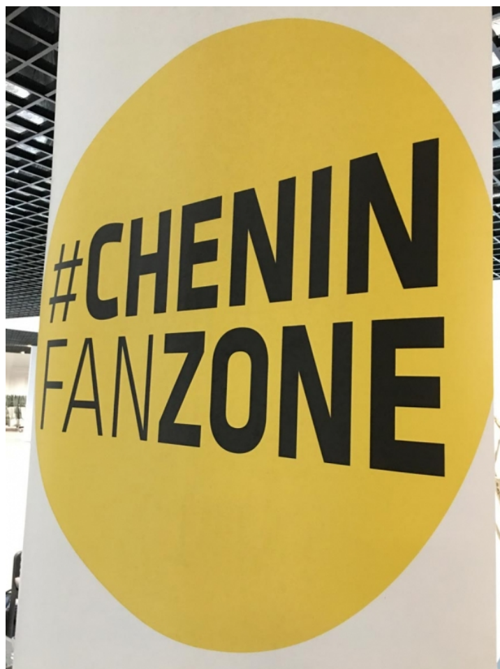
Figure 4 : Marqueur “Chenin” dans un salon.