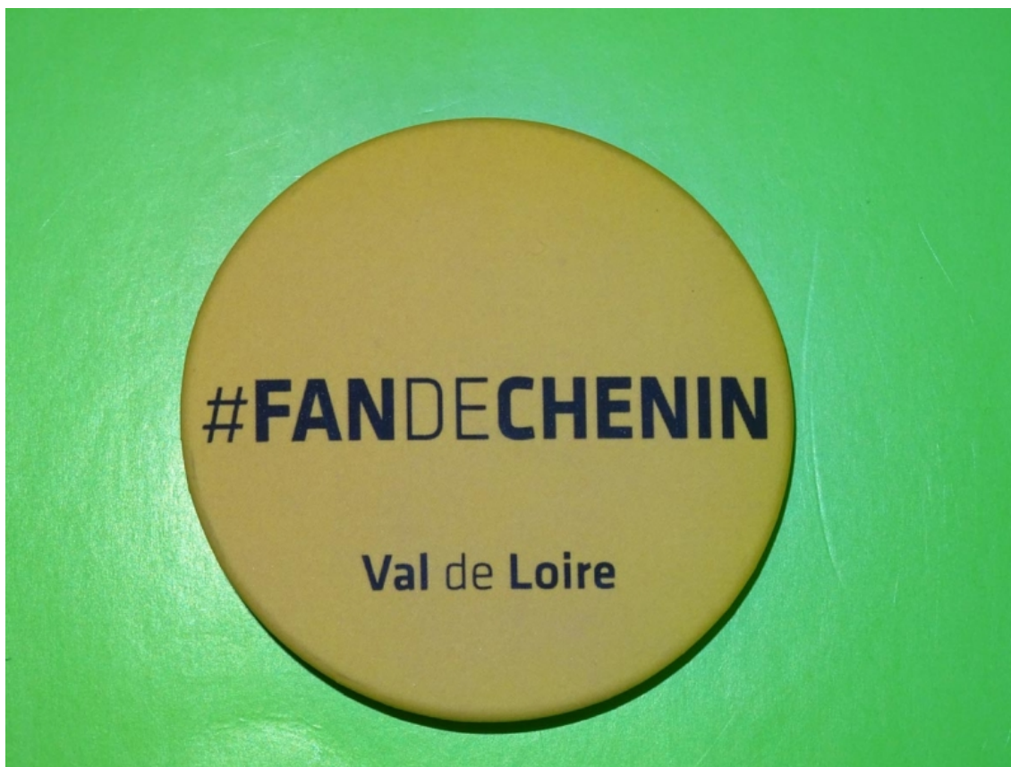
Figure 1 : Le badge “Fan de Chenin”.