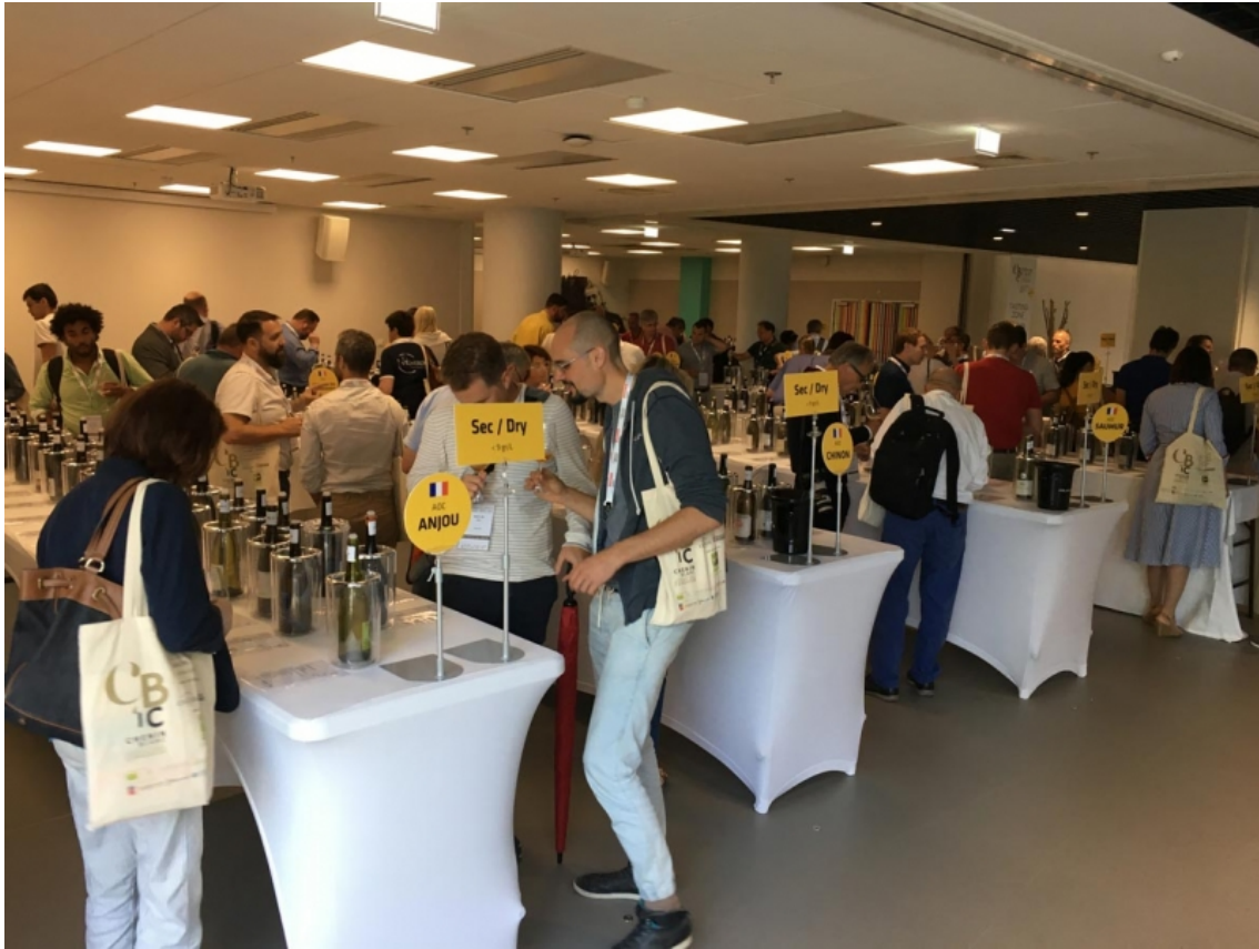
Figure 2 : Fan zone lors d'un salon.