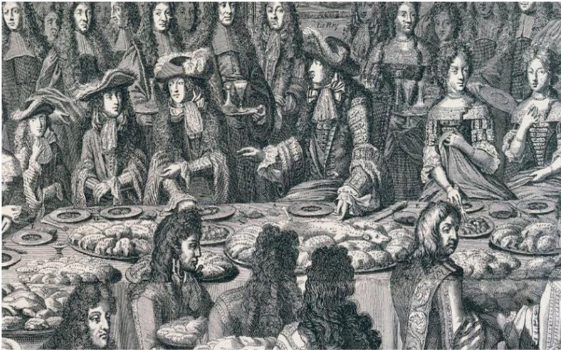
Le « dîner » du Roy à l'Hôtel de Ville de Paris, le 30 janvier 1687. Gravure de Langlois (extrait).