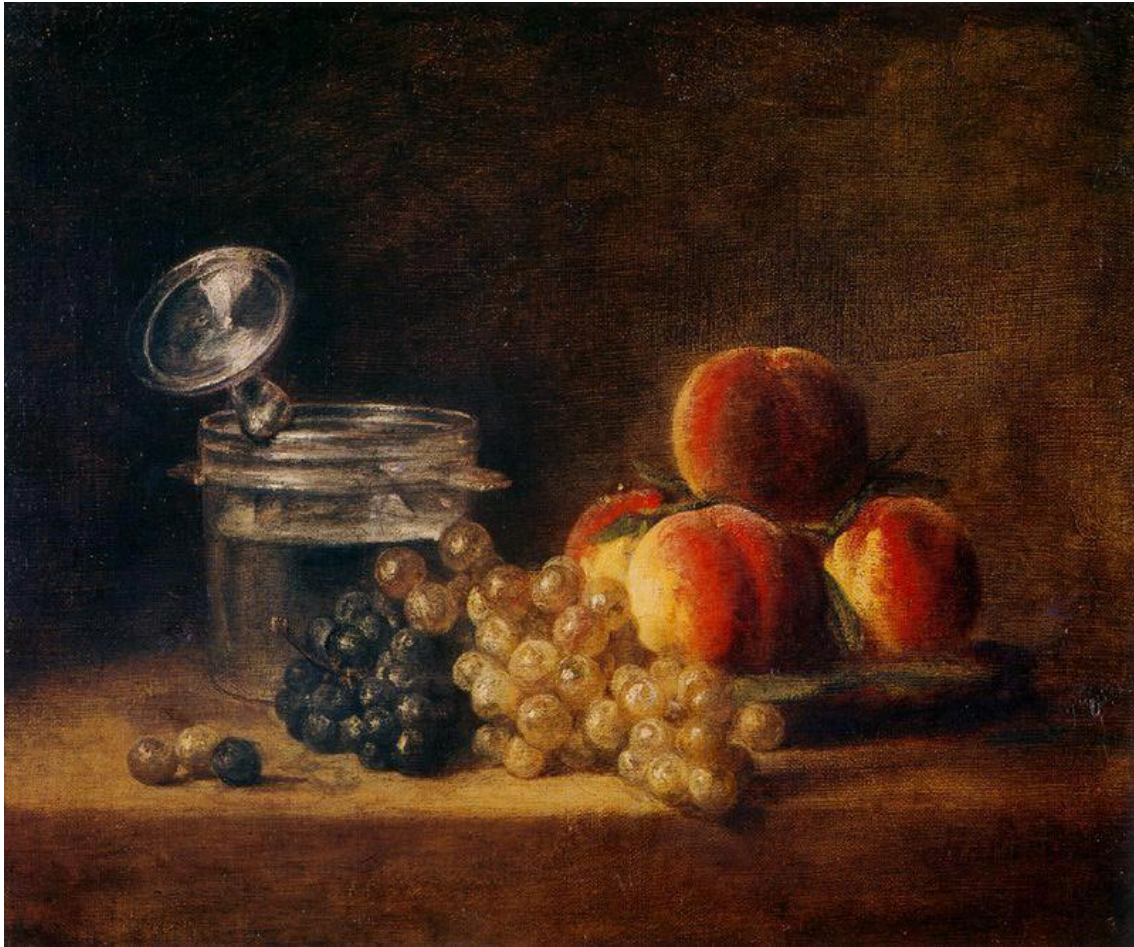
Jean-Siméon Chardin, Le Panier de pêches, raisin blanc et noir, avec rafraîchissoir et verre à pied , 1759, Rennes, musée des Beaux-arts.