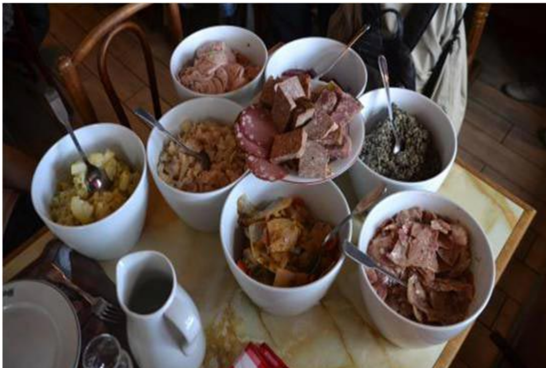
Figure 4 : Les saladiers du bouchon Chabert à Lyon, compagnons du vin unique qu'est le beaujolais ou, pour certains, en début de repas, du mâcon blanc.