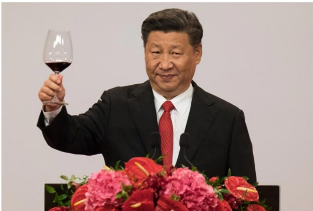
Figure 7 : Le président Xi Jinping porte un toast au vin rouge lors d'un banquet à Hong Kong le 30 juin 2017.