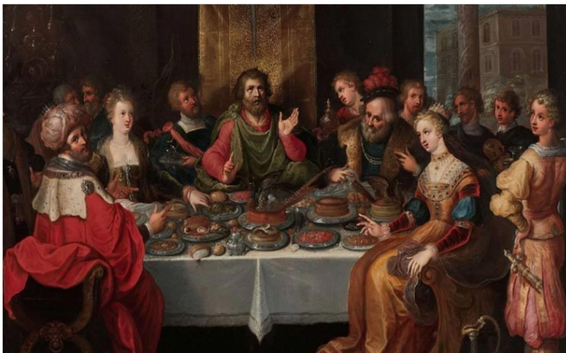
Ambrosius Francken, Le banquet de Damoclès , Anvers, 1563-1618).