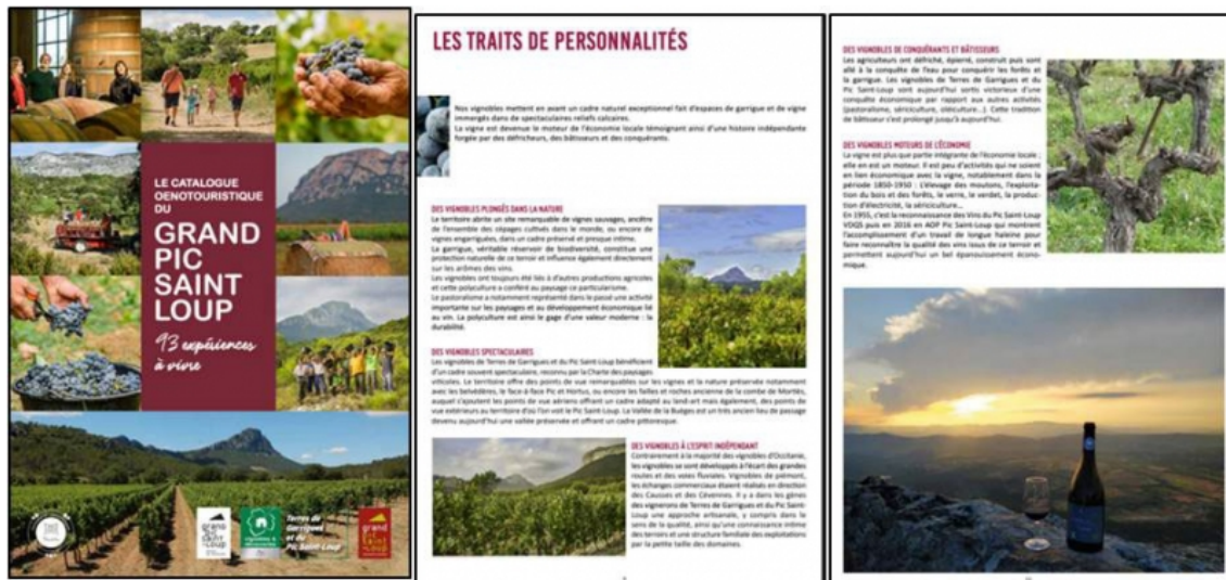
Illustration 7. Visuels de communication de la Communauté de Communes Grand Pic Saint-Loup