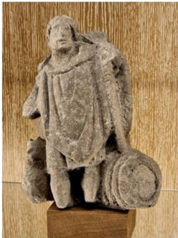
Illustration 2. Statuette de Sucellos, dieu gaulois du vin