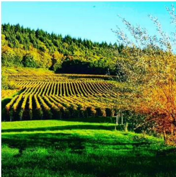
Illustration 1. Paysage du vignoble jurassien