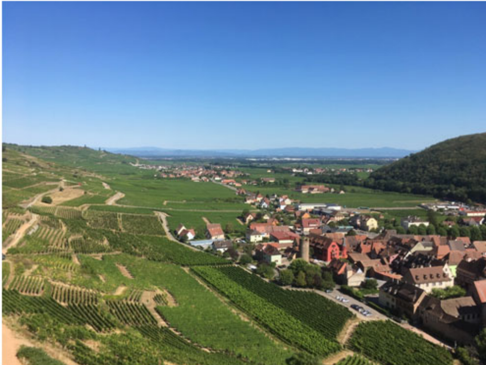
Illustration 3. Le vignoble de Kayserserg et son bourg au pied des vignes, vallée de la Weiss

Les vignes en terrasses (appellation grand cru Schlossberg) se découvrent par des sentiers de randonnée dominant la ville (premier plan) et menant au château de Kaysersberg. La vallée s'ouvre sur la plaine d'Alsace et le village de Kintzheim (second plan). A l'arrière-plan s'affiche la Forêt Noire allemande. Sur la partie droite de la photographie : une des collines sous-vosgiennes formant la transition entre la montagne et la plaine.