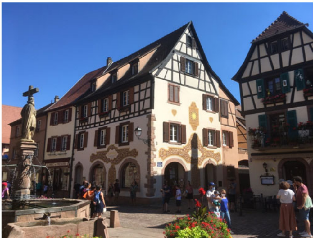
Illustration 4. Une des places de Kayserberg avec fontaine et maison peinte

Kayserberg, l'un des « villages préférés des Français » en Alsace. La rue piétonne et les façades à colombages colorées sur lesquelles sont suspendues des jardinières de géraniums constituent l'une des images de l'authenticité des localités du vignoble.