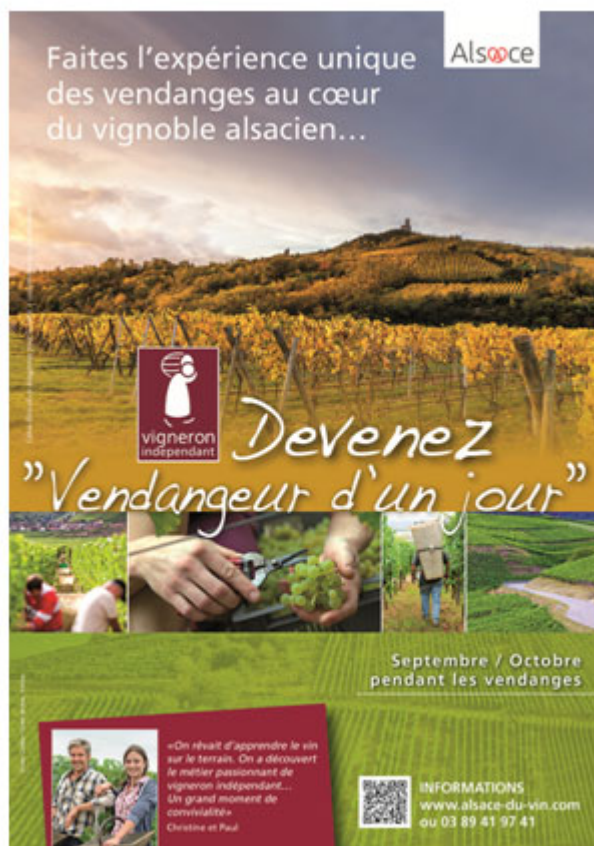
Illustration 7. Publicité pour vendanger, soutenue par les Vignerons indépendants et la marque Alsace