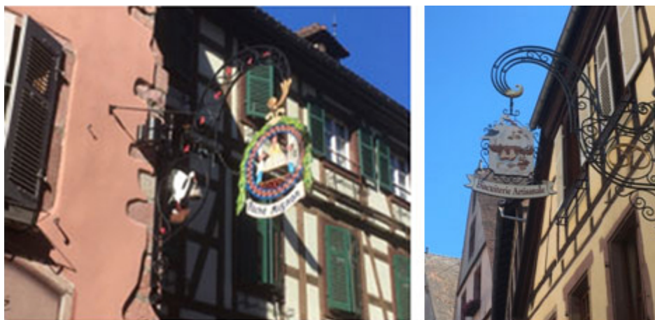
Illustration 2. Enseignes de boutiques vendant des pâtisseries et biscuits traditionnels (Kaysersberg)

Biscuits, bretzels et kougelhops font partie de l'offre gourmande alsacienne.