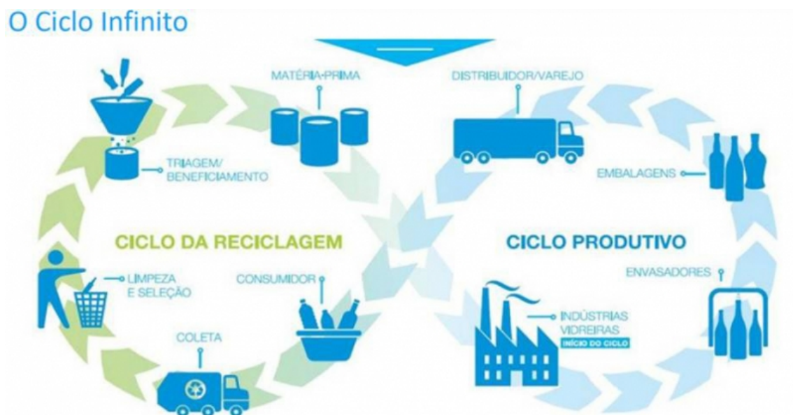
Ilustração 3: Ciclo da EC do Vidro, por ABIVIDRO, 2019 29 .