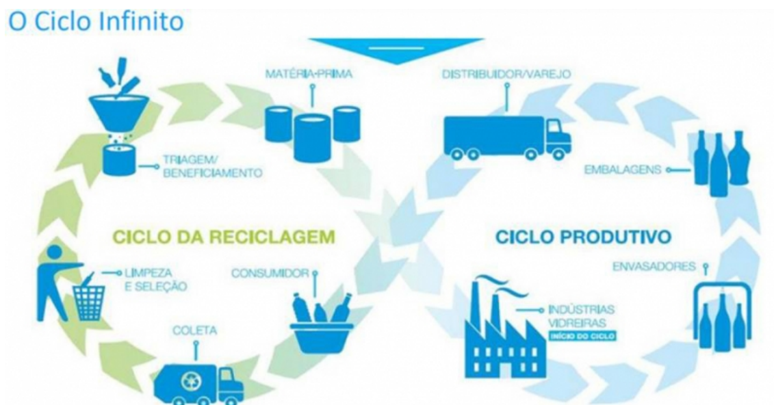
Ilustração 3: Ciclo da EC do Vidro, por ABIVIDRO, 2019 29 .