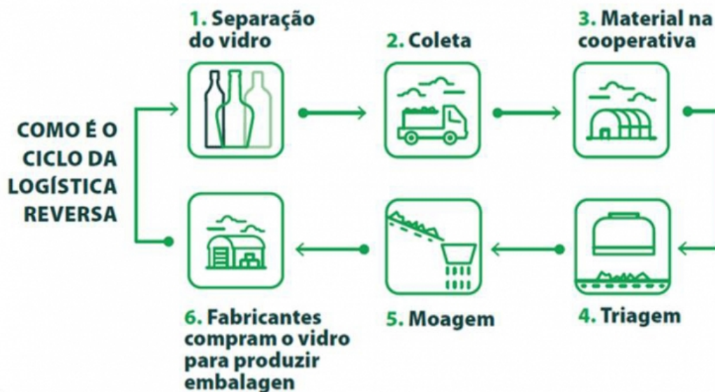
Ilustração 04: O ciclo da Logística Reversa.