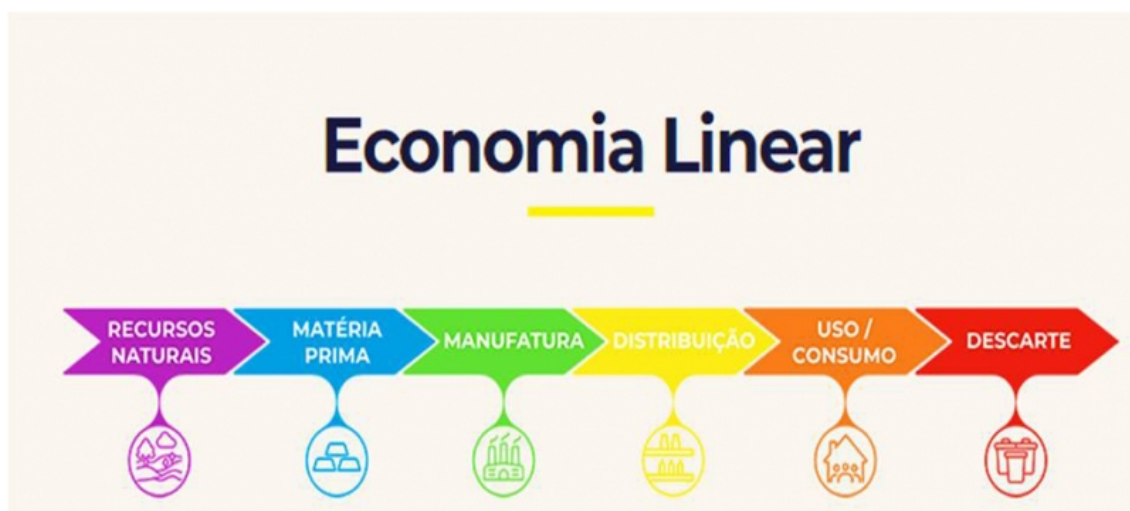
Ilustração 1: Modelo de Economia Linear (EL), por Gejer & Tennenbaum 22 .