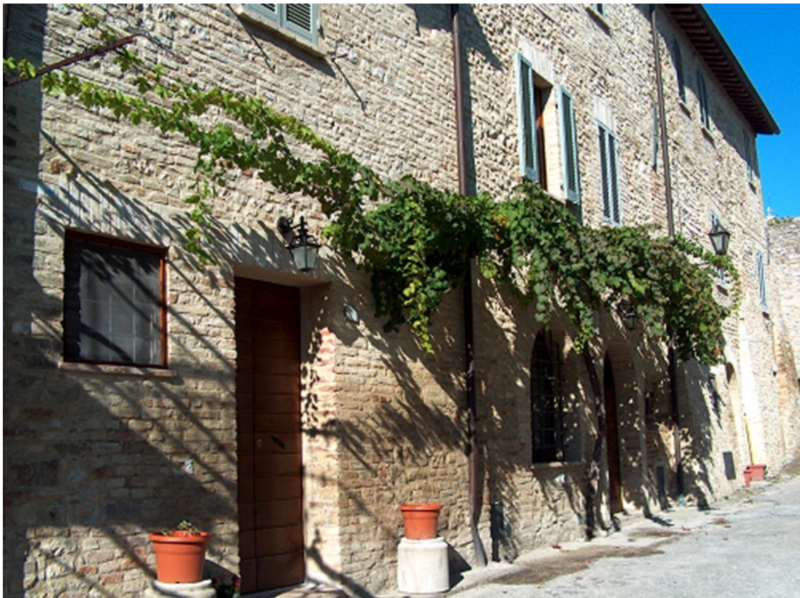
Figure 2 – Dans le centre historique de Montefalco, on peut encore observer des anciens ceps de Sagrantino, « adoptés » par l'un des principaux domaines viticole de la région. (Photo : Consorzio di Tutela Vini di Montefalco).