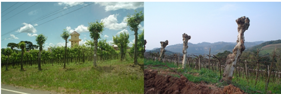
Figure 2 – Le vignoble du Vale dos Vinhedos : repères d'un héritage étrusque

trouvées dans les régions « Asprinio de Aversa » ou « Vinhos Verdes », toutes les deux possédant des origines étrusques, même si les façons culturales sont un peu différentes dans les vignobles recherchés au Brésil (à savoir, Vale dos Vinhedos, Monte Belo do Sul et Pinto Bandeira). Ici, il y a un apport direct des immigrants dans le paysage et dans les pratiques agricoles locales, étant donné que la méthode de conduite n'est pas introduite au Brésil par les Étrusques, mais par les immigrants italiens arrivés au XIX ème siècle (Falcade, 2011).