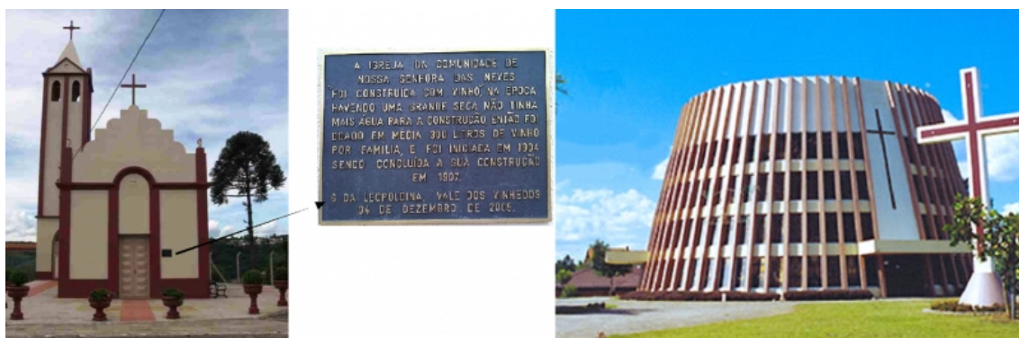
Figure 4 – L'église et le vin : la « Capela das Neves » et l' « Igreja São Bento »

de la photo ci-dessous 1 ). Une autre illustration de cette fusion entre ces deux éléments identitaires, l'église et le vin, est l' « Igreja São Bento », construite en forme de cuve à vin. L'église a été créée en 1982 comme une forme d'hommage aux immigrants italiens et à leur principale activité, la vitiviniculture. Selon des informations fournies par la Préfecture, l'église fut la deuxième au monde à posséder cette architecture.