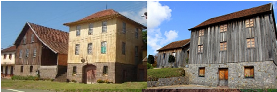
Figure 3 – L'architecture typiques des immigrants italiens dans la Serra Gaúcha

Gonçalves (ici, un exemple de panneaux en bois uniques pour les deux étages).