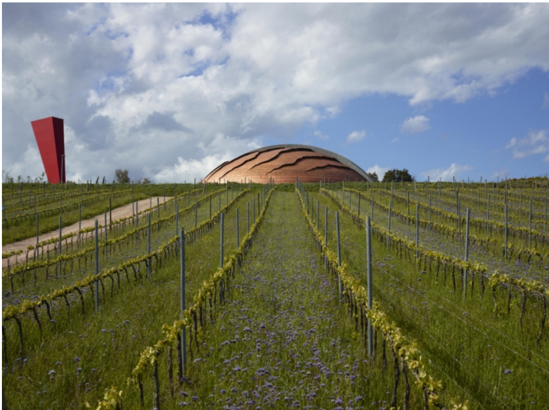
Fig. 4 - Tenuta Castelbuono. La cantina “Carapace” progettata dallo scultore Arnaldo Pomodoro.

è divenuta anche la funzione: non più semplice “contenitore”, ma luogo simbolico e di attrazione per visite e degustazioni.