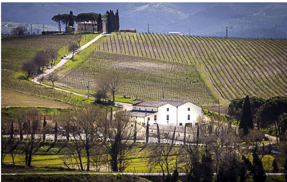
Fig. 3 – L'azienda Scacciadiavoli , nella quale è tuttora operativa la celebre cantina di monumentali dimensioni (“Cantinone”) fatta costruire dal principe Ugo Boncompagni Ludovisi alla fine del secolo XIX.