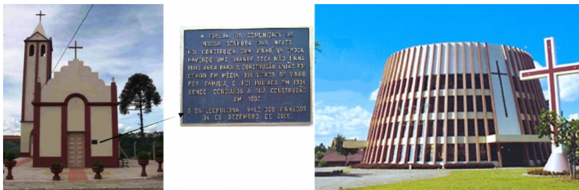
Figura 4 - La Chiesa e il vino : la «Capela das Neves» e l'«Igreja Sao Bento»