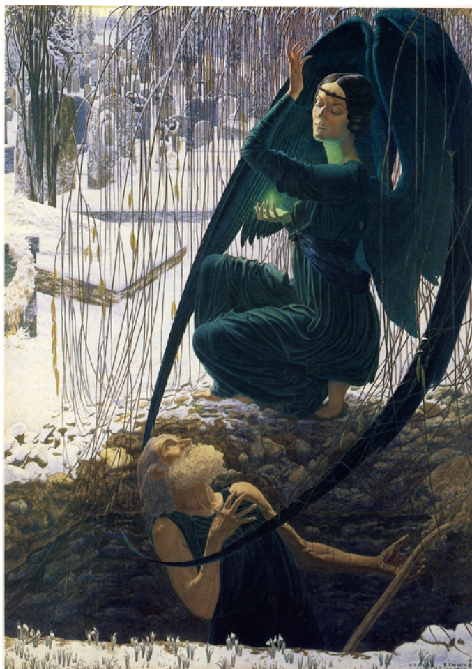
Fig. 4. Carlos Schwabe, « La mort du fossoyeur », 1895-1900

Aquarelle et gouache sur esquisse à la mine de plomb sur papier, 75 x 55,5 cm.