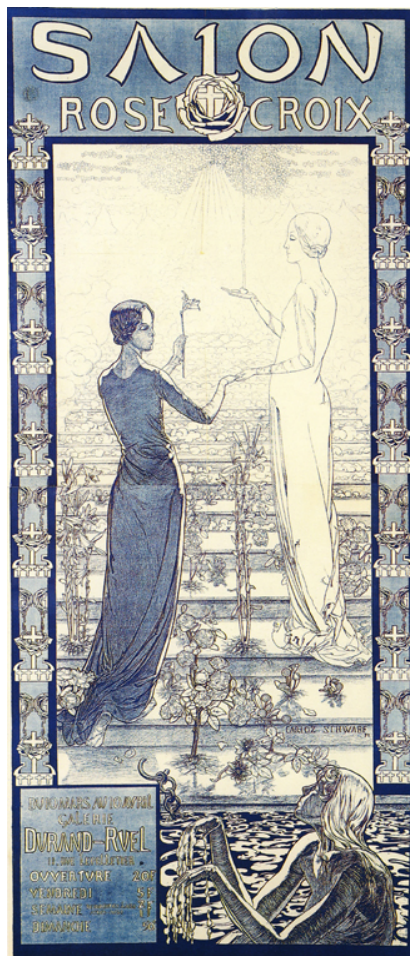
Fig. 2. Carlos Schwabe, affiche du premier Salon de la Rose+Croix, 1892