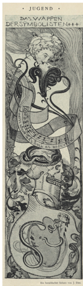
Caricature en noir et blanc de Julius Diez intitulée « Les armoiries des symbolistes +++ » ( Das Wappen der Symbolisten +++ ), 14 x 19 cm.