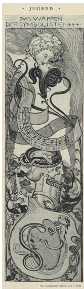
Caricature en noir et blanc de Julius Diez intitulée « Les armoiries des symbolistes +++ » ( Das Wappen der Symbolisten +++ ), 14 x 19 cm.