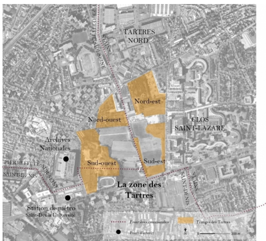
Figure n°2 : Les Tartres à la lisière de trois communes. Carte de localisation sur vue aérienne.

Source : Géoportail. Réalisation : Cécile Mattoug, 2020.