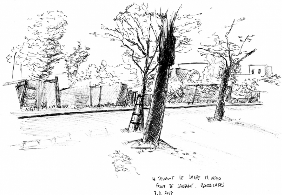
Figure n°5 : Fermeture composite des jardins, Rue Jean Durand, Stains.

Dessin du carnet de terrain, Cécile Mattoug, le 7.11.2017.