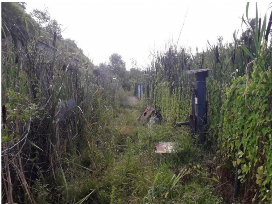
Figure n°6 : Les jardins du Fort de l'Est, Rue du Maréchal Lyautey, Saint-Denis.