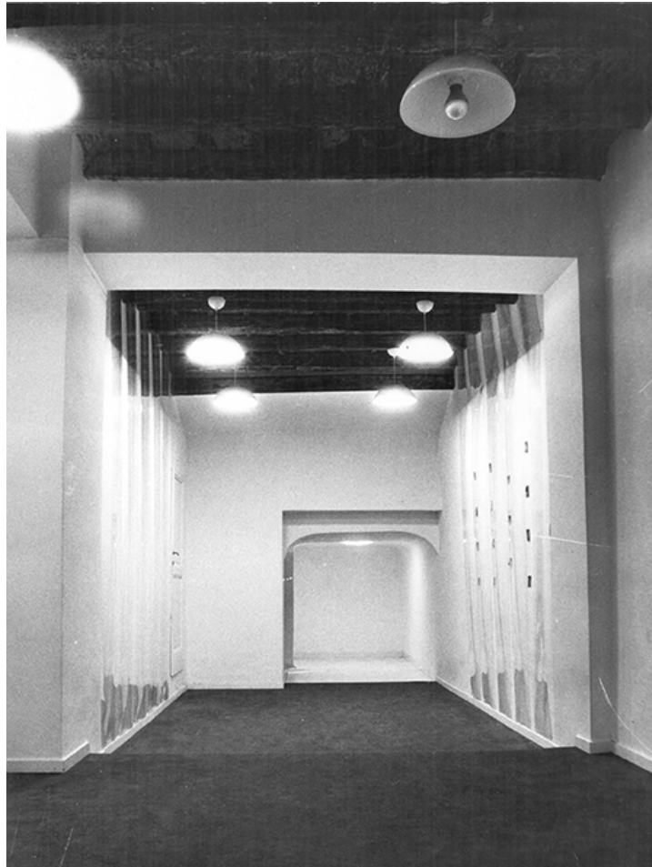
Figure 4. Carla Accardi, Origine , 1976, Cooperativa Beato Angelico, Rom, Installationsansicht.