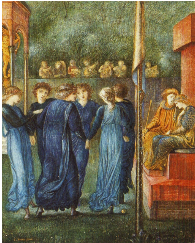
Figure 1 : Les Noces du roi (The King's Wedding), 1870, aquarelle et gouache avec or sur vélin ; 32 x 26 cm ; Neuss, Clemens-Sels-Museum.

https://commons.wikimedia.org/wiki/File:Burne_jones_king_s_wedding.jpg .