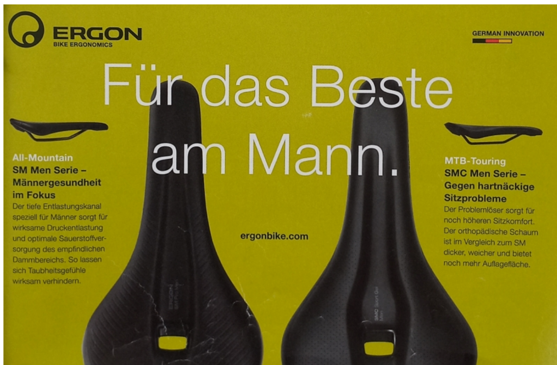
Abb. 5: Mountainbike Magazin 07/2022: 71