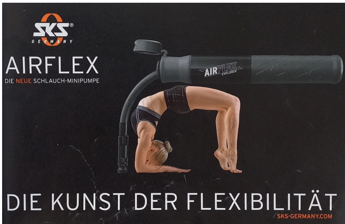
Abb. 9: Mountainbike Magazin, 07/2020: 73