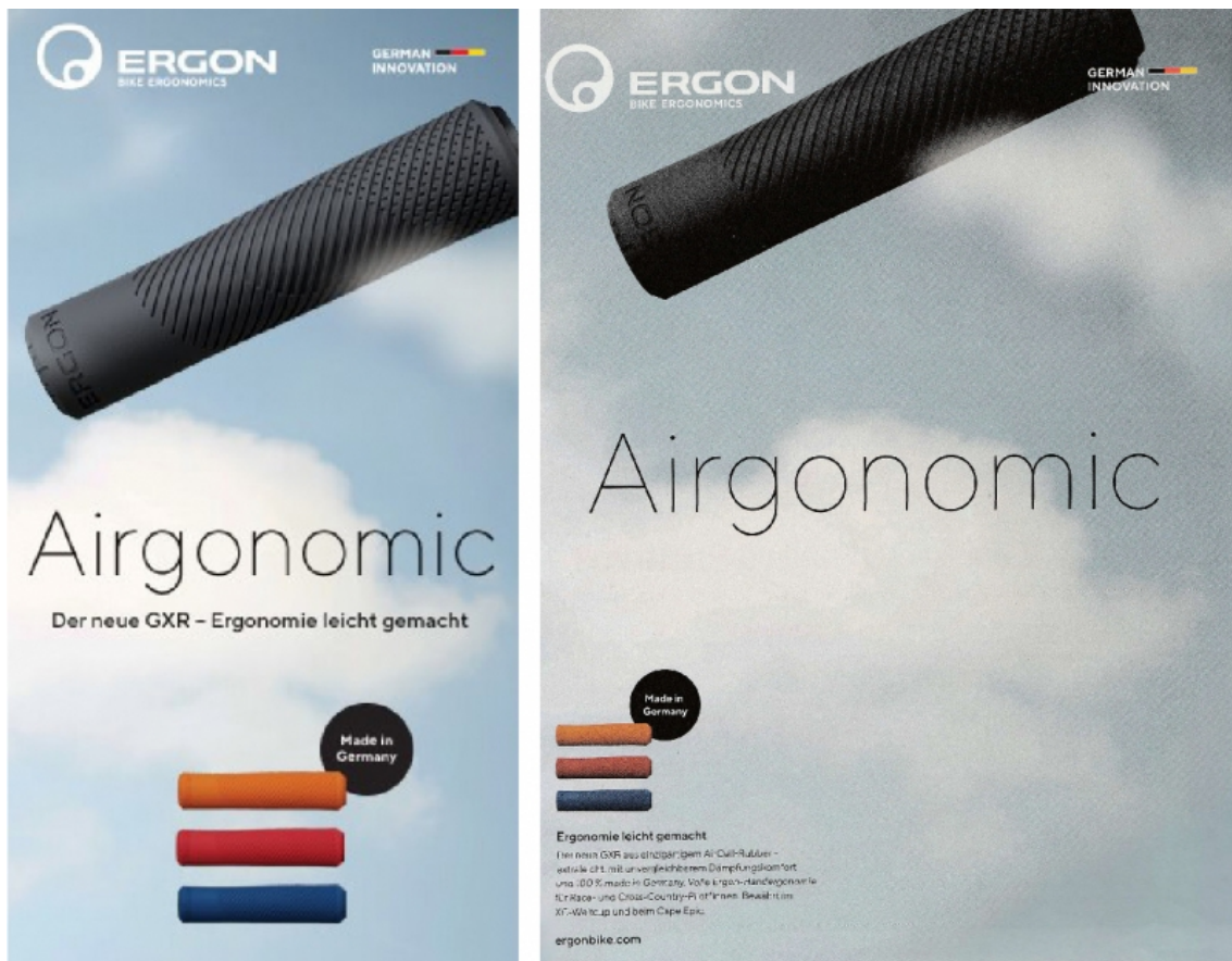
Abb. 7: MTB-News, abgerufen am 16.06.2022. Abb. 8: Bike, 07/2022: 61