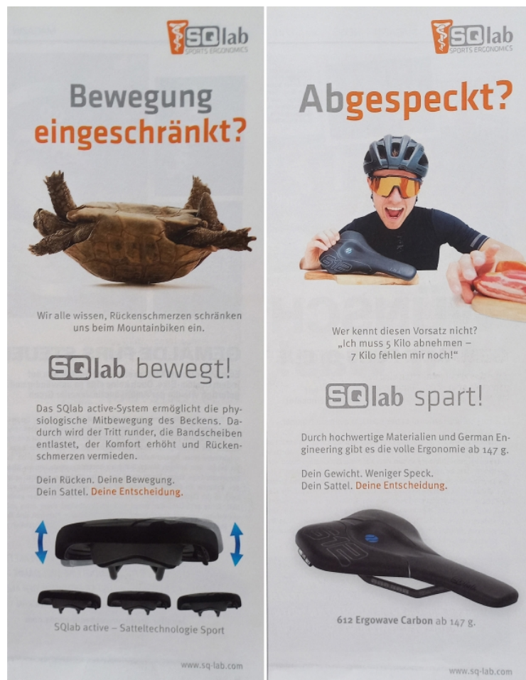
Abb. 3: Bike 04/2019: 29. Abb. 4: Bike 04/2019: 31