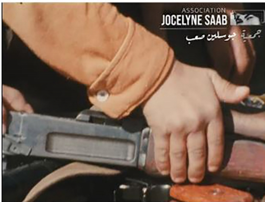
Figure 1 : Les Enfants de la guerre (Jocelyne Saab, 1976).

© Jocelyne Saab Association / Nessim Ricardou-Saab.