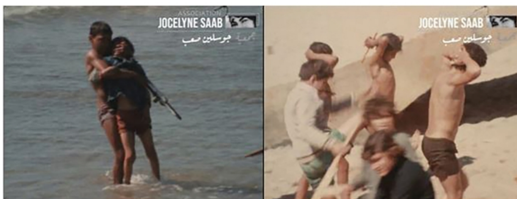
Figure 2 et figure 3 : Les Enfants de la guerre (Jocelyne Saab, 1976).