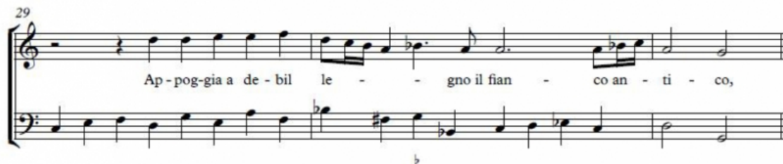
Alessandro Grandi, «Apri l'uomo infelice», mesures 29-31.