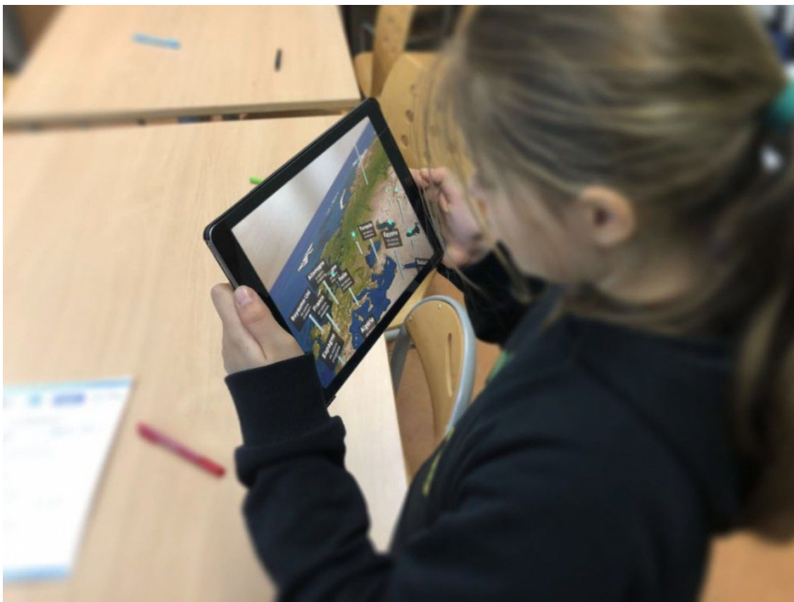
Illustration 2 : Apprenante en interaction avec une maquette.