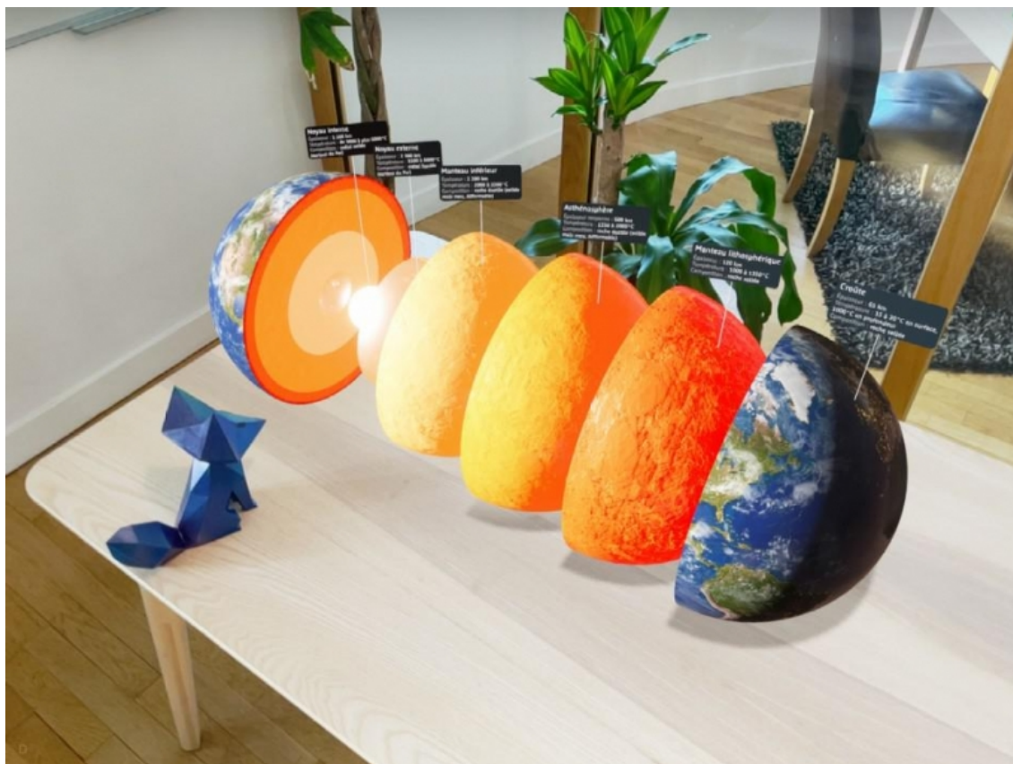
Illustration 1 : Maquette 3D de Foxar ancrée sur une table.

Clémence Rougeot (CR) : Foxar est une start-up qui produit des ressources en 3D et en réalité augmentée, principalement pour l'éducation scolaire, mais aussi pour la formation professionnelle et pour l'industrie. Ce sont des supports virtuels, sur tablettes et smartphones, qui permettent de mieux appréhender les notions abstraites du programme scolaire ; et ce sont des notions qui ne sont pas facilement gérables par certains élèves, quand elles sont en 2D sur papier parce qu'elles comportent des limites : par exemple on ne peut pas forcément voir les échelles de taille. Le fait de pouvoir visualiser les maquettes des notions en réalité augmentée, dans l'environnement réel où elles sont « ancrées » (voir illustration 1), permet de dépasser ces limites.