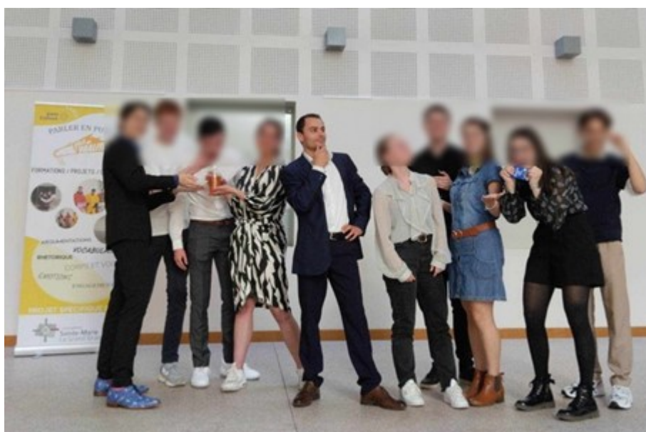
© Sylvain Begon, Le Pôle de l'oralité.