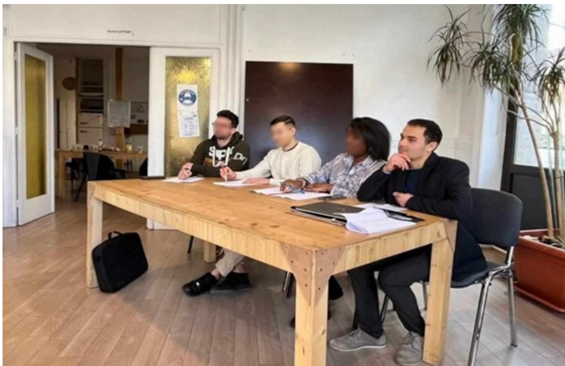
© Sylvain Begon, Le Pôle de l'oralité.