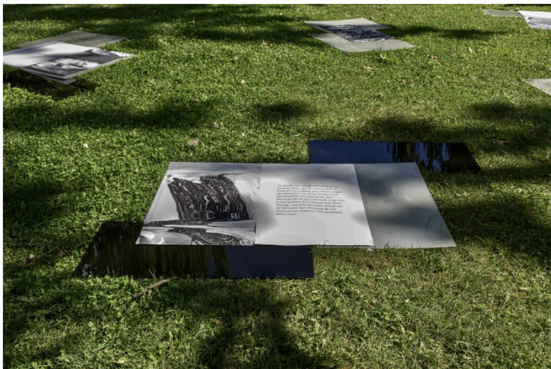
Figure 8 : Vue de l'installation Plasticités tombales de Mimi Haddam, été 2021, Montréal.

pierres tombales, dans une palette chromatique réduite à divers degrés de noir ou de blanc.