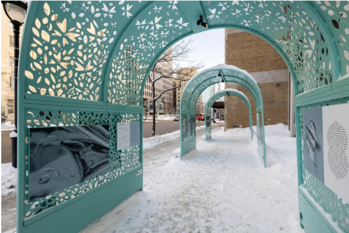
Figure 3 : Vue de l'accrochage de Texturalités de Mimi Haddam et Marion Paquette, hiver 2021, Montréal.