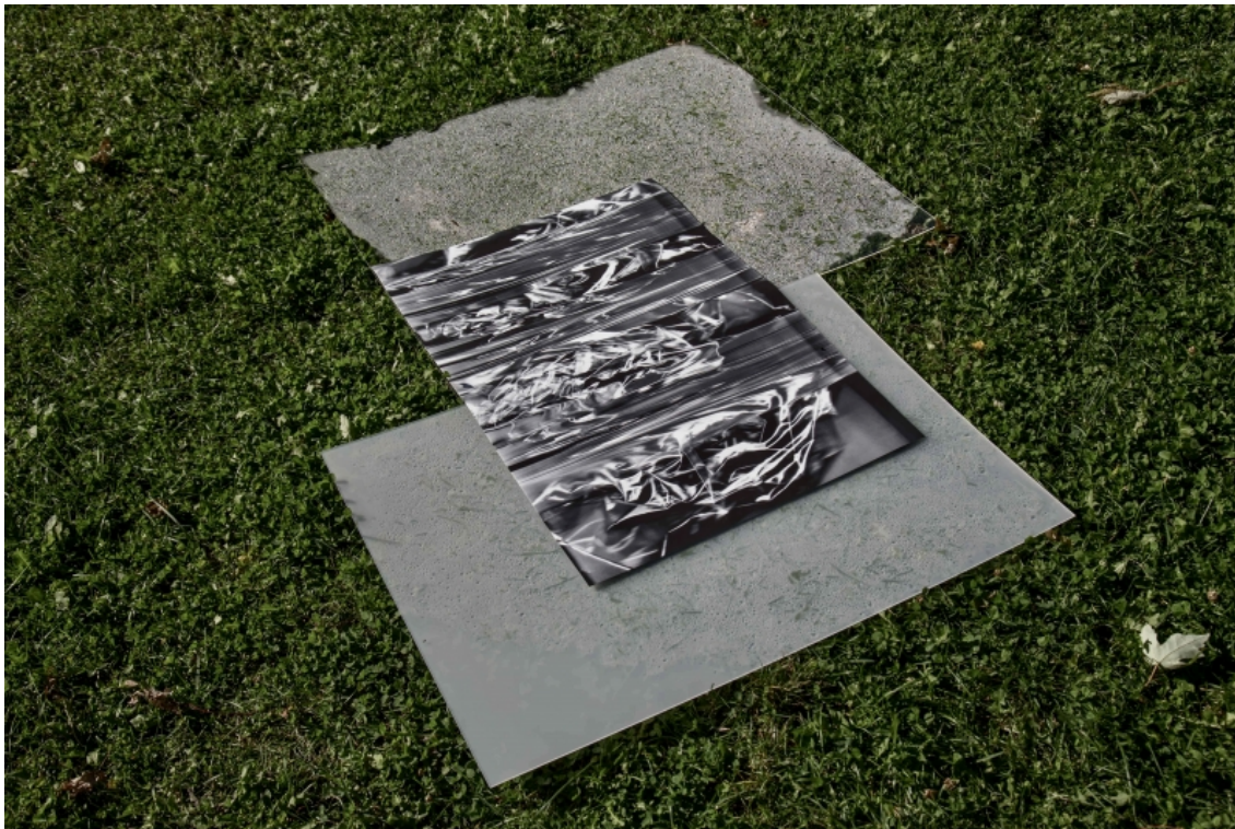
Figure 9 : Détail d'une des pièces de l'installation Plasticités tombales de Mimi Haddam.