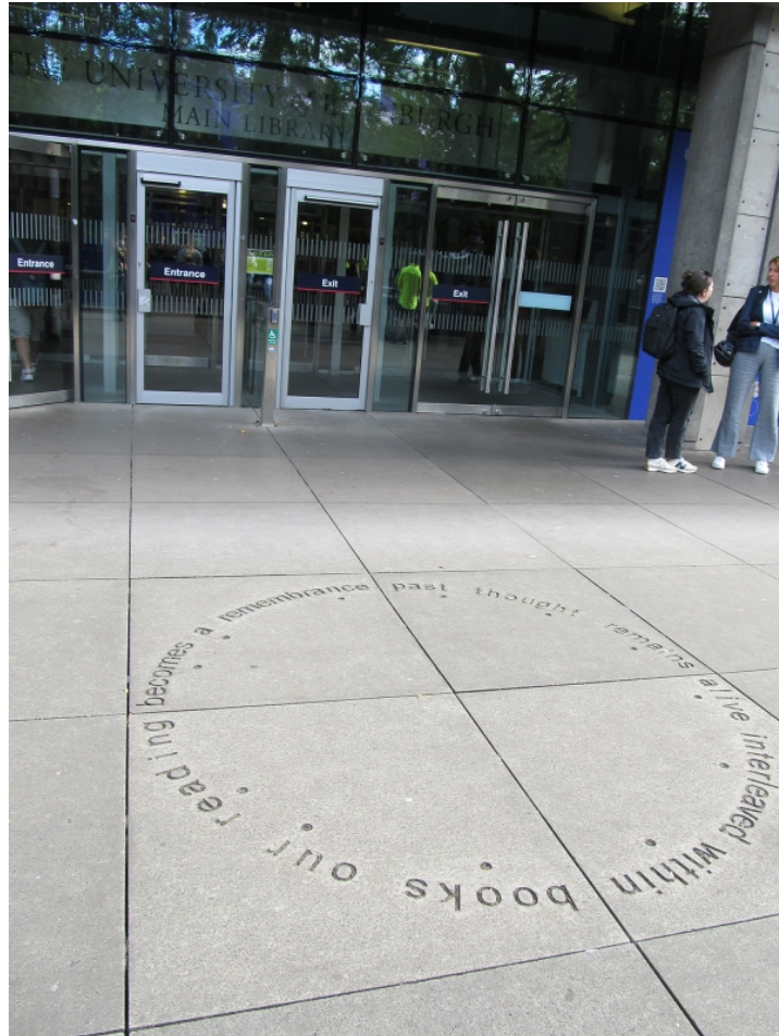
Figure 10 : Alec Finlay, « Interleaved », gravé en 2010 devant le bâtiment principal de la bibliothèque de l'Université d'Édimbourg.