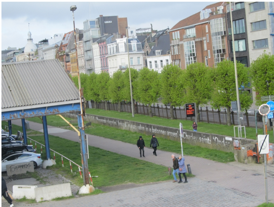
Figure 5 : Peter Holvoet-Hanssen, « Welkom Pierewaiers », poème peint en 2012 sur les quais le long de l'Escault, à Anvers.