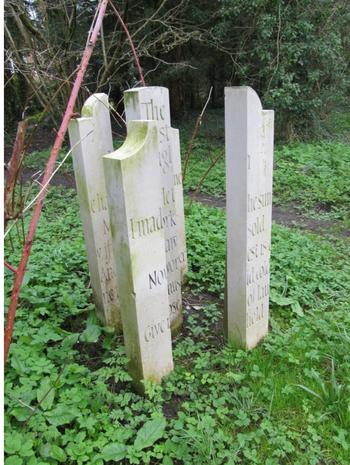
Figure 6 : Alec Peever, « The Last Laugh », poème de John Betjeman installé en 2002 au John Betjeman Millenium Park de Wantage.