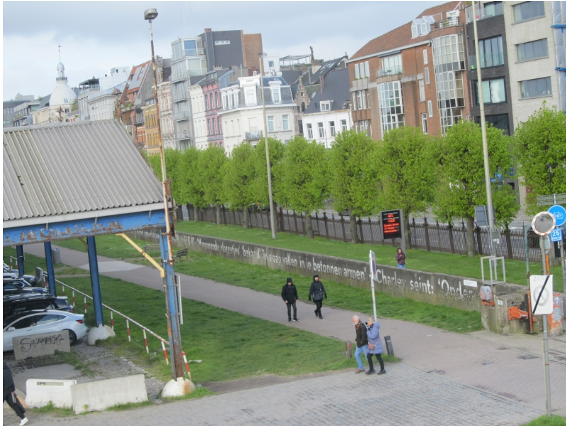
Figure 5 : Peter Holvoet-Hanssen, « Welkom Pierewaiers », poème peint en 2012 sur les quais le long de l'Escault, à Anvers.