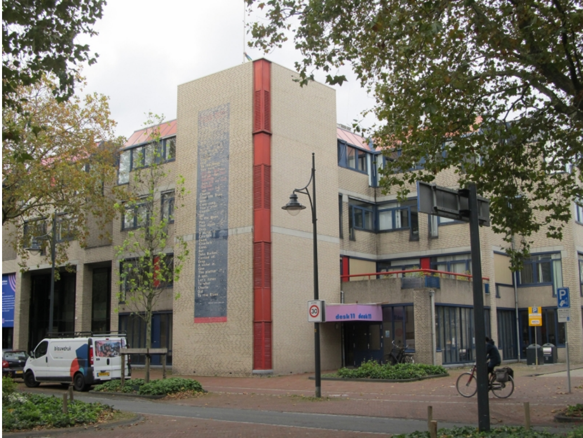
Figure 2 : Fondation Tegen-Beeld, « Charles Parker (1920-1955) », poème de William Waring Cuney, peint en 2005 à Leyde.