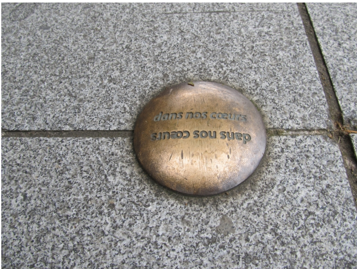
Figure 4 : Groupe de l'Oulipo, clou gravé pour « Les Clous de l'Esplanade », poème installé en 2010 sur l'esplanade Charles-de-Gaulle, Rennes.

Cliché : Claire Gheerardyn, décembre 2025.