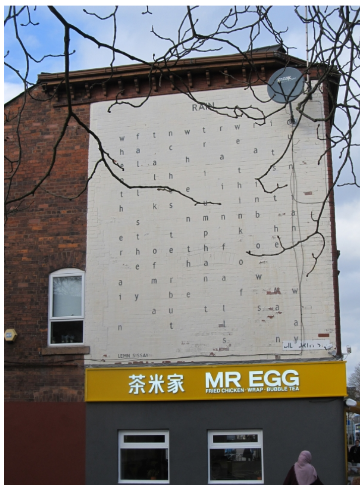
Figure 9 : Lemn Sissay, « Rain », poème peint en 1998 à Manchester.