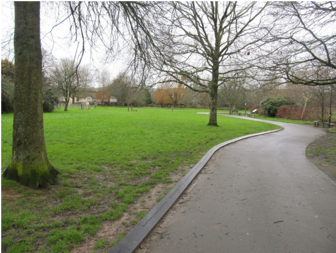
Figure 8 : Coleridge Memorial Trust, « The Kubla Khan Poetry Stones », poème de Samuel Coleridge installé à Ottery St Mary en 2012.

Cliché : Claire Gheerardyn, février 2024.