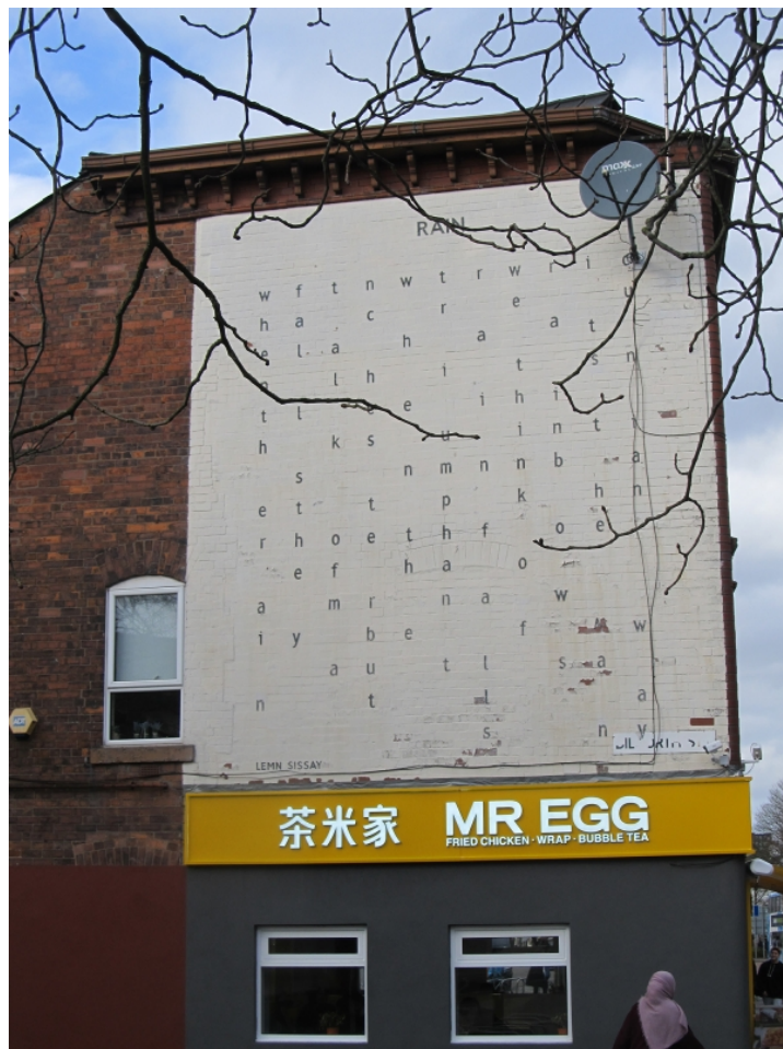
Figure 9 : Lemn Sissay, « Rain », poème peint en 1998 à Manchester.