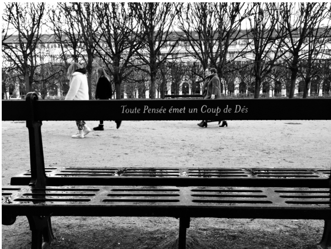
Figure 1 : Banc & Poème, installation de 34 Bancs & Poèmes au jardin du Palais Royal, Paris, 2016-2024