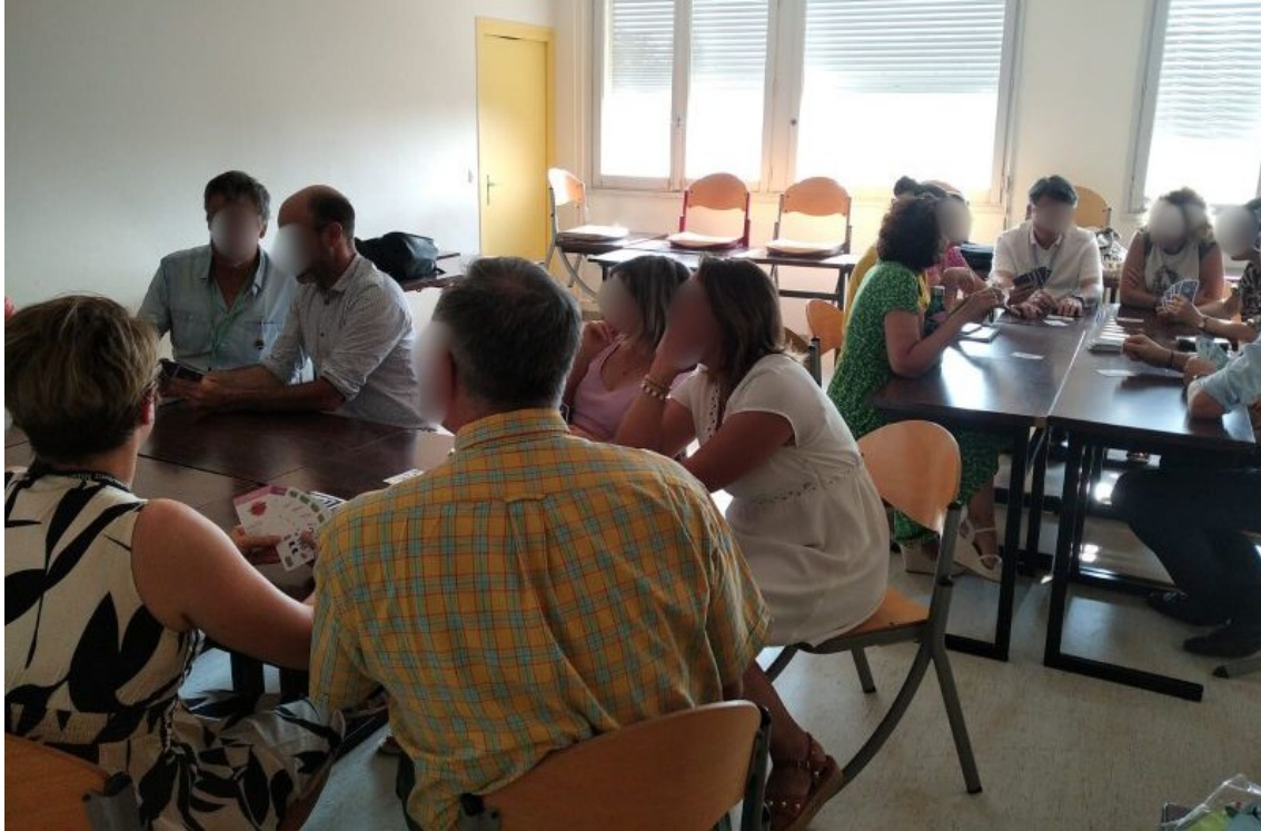
Illustration 2 : Intervention auprès de 40 personnes parmi les plus haut·e-s responsables d'un hôpital.