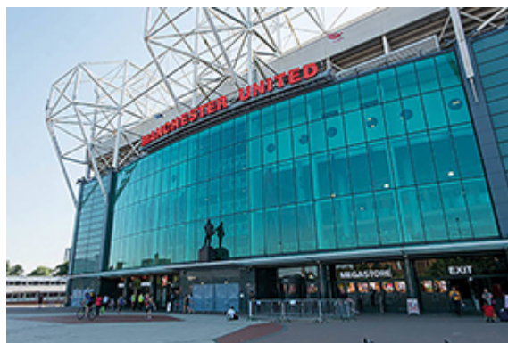
Figure 2 : le mégastore de Manchester United à Old Trafford.