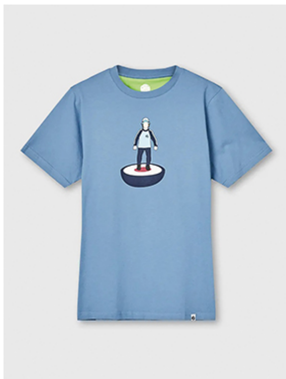
Figure 3 : T-shirt Pretty Green, 2022.