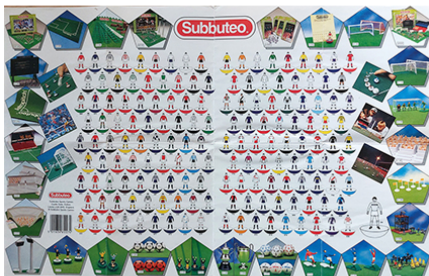
Figure 2 : un Subbuteo Wallchart du début des années 1990, affichant 162 équipes ainsi que des coffrets et accessoires.

Sont disponibles l'AS Saint-Étienne (no. 393), l'OM (no. 674), le FC Nantes (no. 759), mais on cherche en vain le PSG.