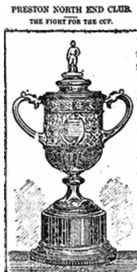
Figure 2 : « Preston North End. The Fight for the Cup », The Preston Herald , samedi 30 mars 1889.