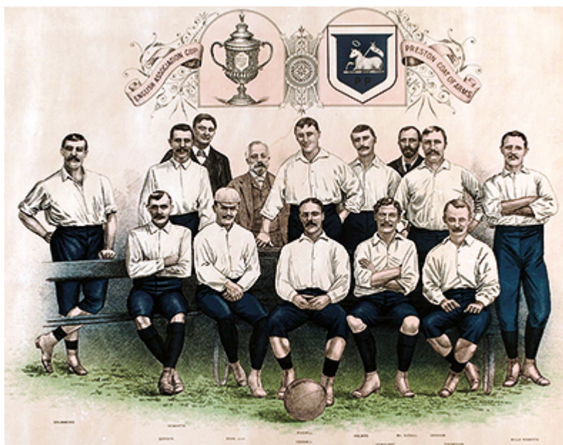
Figure 1 : l'équipe de Preston North End lors de la première saison de la Football League (First Division) 1888-1889.