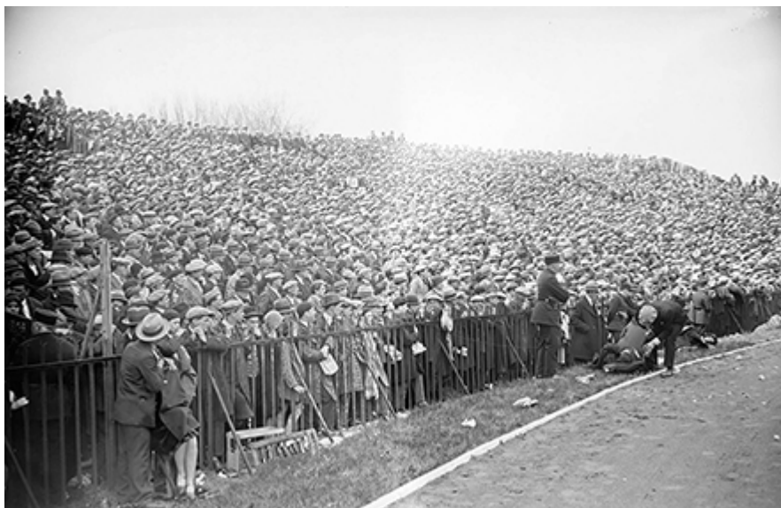
Figure n° 1 : Les spectateurs du match France-Pays de Galles de rugby stade de Colombes, 21 avril 1930.

Une foule passionnée et nerveuse suit le match France-Pays de Galles dont l'issue victorieuse pourrait donner aux Bleus leur première victoire finale dans le Tournoi des Cinq Nations.