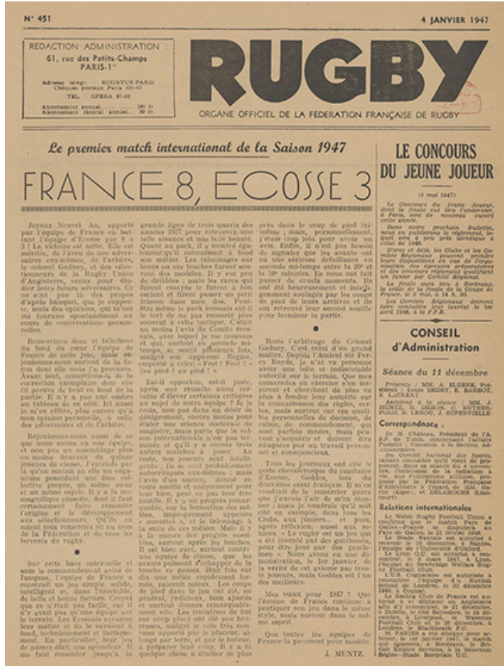
Figure n° 3 : Une de Rugby. Organe officiel de la Fédération française de rugby, 4 janvier 1947.

Le quinze de France fait un retour victorieux dans le Tournoi des Cinq Nations en dominant l'Écosse 8-3 le 1 er janvier 1947.